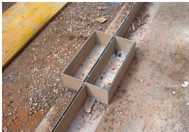
Rue de la République. Mise en place du caniveau à fente sur la plate-forme support.