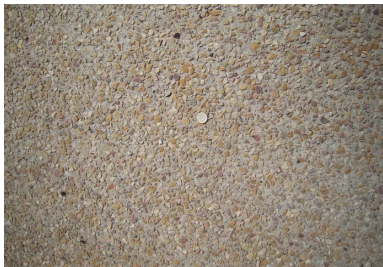
Rue de la République : trottoir en béton désactivé teinté.