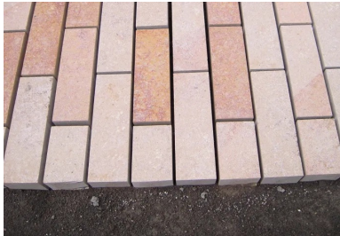
Le Buxy est une roche sédimentaire compacte. C'est un calcaire à grains fins et serrés et à petits cristaux de calcite, de couleur jaune-roux. Cette pierre naturelle peut présenter des taches ovoïdes et des zones flammées ou veinées de couleur lie-de-vin à mauve ou grise. Le Buxy est une pierre très dure, apte au grand trafic. Cette pierre peut être flammée pour obtenir une surface rugueuse antidérapante. Le Buxy est une pierre non gélive.