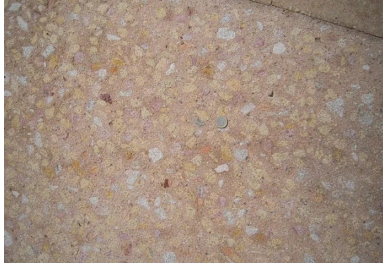
Rue de la République : aire de stationnement en béton bouchardé.

Nous attendons avec impatience la deuxième phase du projet d'aménagement, prévue en 2018.