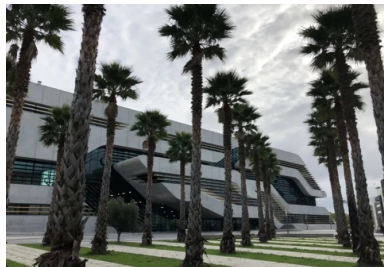
Pierre Vives (Zaha Hadid arch.)

Rencontre CINOV. L'innovation du label E+C- dans l'éco-construction. Le béton, contradiction ou opportunités RDV : Lundi 5 novembre 2018 de 14h30 à 18h30. Pierrevives, 907 rue du Professeur Blayac. 34 000 Montpellier