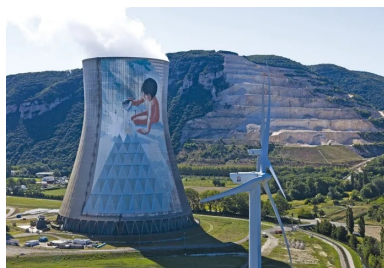
Jean-Marie Pierret - Le Verseau, 1991. Centrale nucléaire de Cruas.

C'est en empruntant un chemin de randonnée que l'on découvre la fresque de Ella & Pitir. Ils travaillent ensemble depuis plus de 10 ans et sont connus pour leurs peintures géantes au sol ou sur les toits, représentant des « colosses endormis » dans le chaos des villes. De nombreuses créatures du duo stéphanois sont en train de dormir les jambes ramassées, contraintes par le cadre imposé du support choisi, comme au barrage du Piney de la commune de La Vallée-en-Gier au Pilat, avec la fresque « Le Naufrage de bienvenue ». Une commande de la ville de Saint-Étienne ayant demandé 10 jours de travail. Ce nouveau géant de 47 m de hauteur et au calme étrange du sommeil des enfants est appelé à s'inscrire dans le patrimoine régional. Il est porteur d'un ailleurs, d'autres possibilités de vie et de rêves à inventer. Une échappée belle poétique, esthétique et politique.