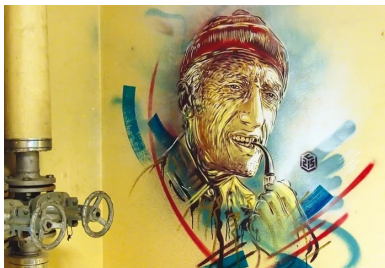
C215 - E = MC215 - commandant Jacques-Yves Cousteau, 2015. CEA de Saclay.

Diderot soulignait que « le patrimoine, c'est aimer et désirer ce que l'on possède déjà », pourtant le patrimoine, c'est aussi le mélange des cultures. Ainsi, comme l'ont montré les Streets artistes à travers le monde, les graffitis et le Génie Civil à priori antinomiques, se rejoignent sur le terrain de l'art.