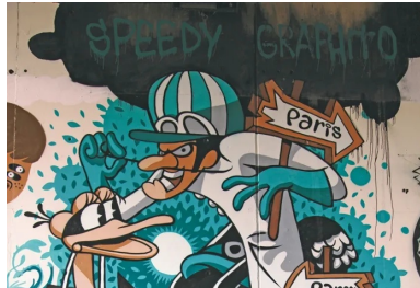
Graphito - Festival « La voie est libre » à Montreuil, 2012. [©Speedy Graphito]

Le Street Art joue le rôle de la sentinelle inductrice de prise de conscience sociétale. Tel un jeu virtuel de subversion urbaine, le Street Art induit une vision nouvelle des murs du quotidien. Par ce détournement du mobilier urbain, les artistes en métamorphosent les espaces comme par la magie d'un regard entre les guillemets d'un panneau publicitaire ou d'une palissade de chantier. C'est la liberté de réinventer le monde dans une joyeuse contestation créative.