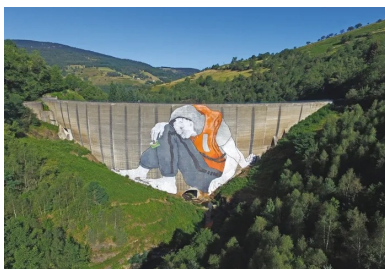
Ella & Pitr - Le Naufrage de bienvenue, barrage du Piney, 2017. [© Ella & Pitr]

Grand projet de l'été 2014, la peinture réalisée sur le château d'eau de Blanzly, en Saône-et-Loire, a pris beaucoup de temps et d'énergie. La surface à peindre est d'environ 250 m 2 . « Perchés à 15 m de hauteur sur notre nacelle, nous n'en menions pas large. La maquette a été réalisée avec les enfants et adolescents de la ville sous forme d'ateliers en partenariat avec le centre social local. Elle a ensuite été validée par la mairie, la communauté de communes et Orange France Télécom. Nous avons travaillé sur une représentation de la ville de Blanzly, ses monuments et points de repère, ses activités et ses habitants », explique Reno Kidd.