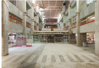
Pour permettre l'accès au chantier, une « faille » de 90 m de long, 10 m de large et 20 m de profondeur a été découpée dans les dalles des parkings existants.