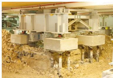
Le système de reprise en sous-œuvre consiste à transférer provisoirement les charges des poteaux vers des massifs de micropieux.

L'ensemble est totalement sécurisé : des capteurs et des alarmes veillent à l'intégrité des circuits hydrauliques et la géométrie des ouvrages est vérifiée en continu. « En cas de perte de pression dans les vérins ou en cas de déplacement inopiné, une alerte est déclenchée et le système compense instantanément la défaillance. »