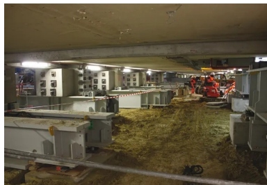
Les 119 poteaux existants sont repris en sous-œuvre afin de pouvoir construire la gare souterraine.

Ces trois gares seront reliées au terminus actuel Haussmann-Saint-Lazare par l'intermédiaire d'un nouveau tunnel de 8 km. La majeure partie de cet ouvrage est réalisée sur 6,1 km au moyen d'un tunnelier à confinement de 9,6 m de diamètre (groupement Bouygues Travaux publics). Pour la traversée de la Défense, l'ouvrage monotube se divise en deux plus « petits » tubes - réalisés en méthodes traditionnelles par le groupement e-déf, Eole-La Défense -, un changement de conception qui permettra de limiter les interférences avec les ouvrages existants.