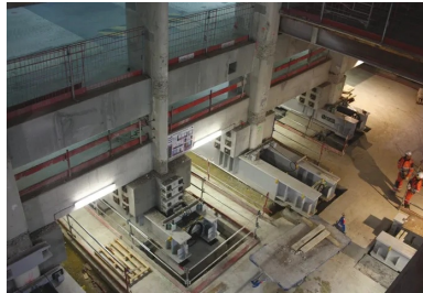
C'est par la « faille » que seront évacués les 150 000 m 3 de terre excavée lors du terrassement en taupe de la gare.

Car, puisque la dalle de couverture de la gare, qui constitue aussi le plancher du niveau bas des parkings existants, est maintenant achevée, les 119 poteaux existants, dont les charges avaient été transférées sur des appuis temporaires, sont mis en connexion avec elle. Le système de descente de charges est alors le suivant : les 119 poteaux existants sont soutenus par la nouvelle dalle supérieure de la gare, qui transfère ces efforts dans les 61 nouveaux piliers.