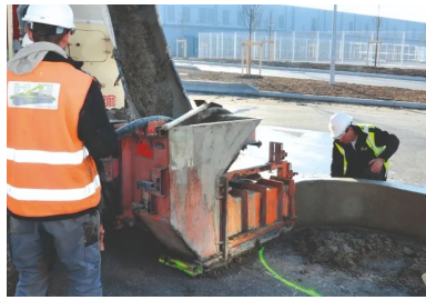
Les grandes étapes de la réalisation des bordures en béton extrudé