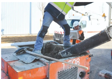
Les grandes étapes de la réalisation des bordures en béton extrudé