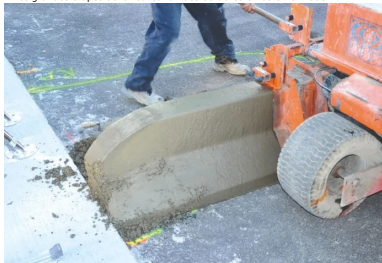
Les grandes étapes de la réalisation des bordures en béton extrudé