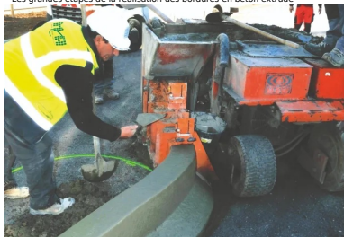
Les grandes étapes de la réalisation des bordures en béton extrudé