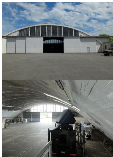
Vue du pignon ouest : les portes datent de 1945.

2 - Construction Moderne - Annuel Ouvrages d'art 2013.