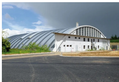
Vue du pignon est, mûré par l'adjonction d'appentis intérieur.

Mais c'est en 1919 à Villacoublay que Freyssinet réalise une des plus belles structures de hangar à voûtes, également détruite en 1944. Située à côté des hangars Piketty construits en 1918 sur les mêmes bases que les hangars de type Lossier, le hangar de Freyssinet est constitué par la juxtaposition de trois voûtes en berceau parallèles, coupées par deux autres voûtes centrales perpendiculaires joignant la clé des premières voûtes. La surface intérieure libre de tout poteau atteignait 120 m de largeur par 45 m de profondeur, correspondant par là même au projet de hangar imaginé par Freyssinet dès 1913.