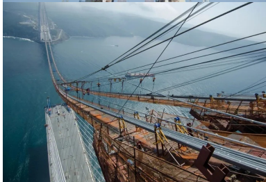
... avec des fûts convergents réunis par une entretoise en partie supérieure.