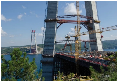
Le pylône européen est fondé sur la rive, non dans l'eau.

Le programme insistait sur la qualité architecturale et imposait un ouvrage suspendu dans la lignée des ouvrages existants. Autre impératif, remettre l'offre fin avril : les concepteurs disposaient donc de huit semaines pour concevoir le projet ! C'est peu... Ni une ni deux, les deux ingénieurs, qui se connaissent bien, se mettent au travail et, en l'absence de données, lancent une véritable « machine de guerre » en faisant appel aux expertises de leurs relations.