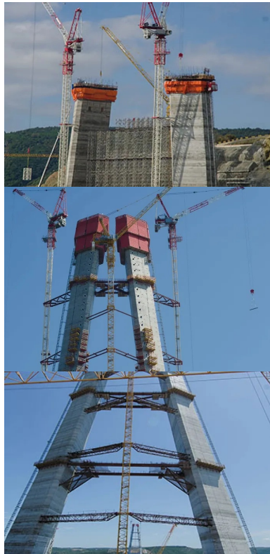
Ils ont réalisés jusqu'à 208 m de hauteur avec un coffrage glissant.

Ce prix exceptionnel remis par l' International Association for Bridge and Structural Engineering , distingue des structures remarquables, innovantes, créatrices et stimulantes partout dans le monde. Il a été attribué le 19 septembre 2018 lors du 40e Symposium IABSE à Nantes en France.