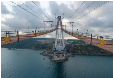
Un pont suspendu à haute rigidité pour franchir le Bosphore.

Autre tour de force : la construction, dont le concours stipulait qu'elle devait se dérouler en 36 mois. Elle commence officiellement, le 29 mai 2013, date anniversaire de la prise de Constantinople (1453). En réalité, le consortium Astaldi-Içtas, qui voulait sous-traiter la réalisation de l'ouvrage, a pris le risque de démarrer les travaux avant même d'avoir choisi les sous-traitants. Lorsque l'entreprise coréenne est arrivée, une avancée dans le Bosphore était réalisée pour installer le chantier et les fondations des pylônes étaient creusées. Contrairement au programme qui stipulait l'implantation du pylône européen dans l'eau, Michel Virlogeux et Jean-François Klein choisissent de le fonder sur la rive. Il leur faudra mobiliser une grande force de persuasion pour convaincre l'entreprise d'allonger la portée du tablier, qui passe ainsi de 1 255 m à 1 408 m, nouveau record dans la catégorie des ouvrages à « haubans suspendus ». Jusqu'alors détenu par le pont Russky (2012). « Au final, tout le monde s'est félicité de ce choix judicieux qui a permis de sécuriser le planning et les coûts en évitant les aléas des travaux off-shore », résume Jean-François Klein.