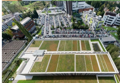
La toiture-terrasse, végétalisée en damiers, et qui reprend les coloris des bétons de façades.

Maître d'ouvrage : SEDIF - Maître d'œuvre : groupement : Lelli Architectes, Dominique et Giovanni Lelli ; Artelia ; BG Ingénieur-conseil - BET : BG, Artelia, Bton Design - Fournisseurs bétons : Holcim pour la structure, Lafarge pour le Ductal - Entreprise de préfabrication : Edycem Naullet - Conception des plaques scintillantes : Bton Design - Protection : Grace Pieri ; Graffistop et Hydroxi - Entreprises : Bouygues TP ; Sogea ; CSM Bessac ; Soletanche Bachy - Surface : 5 600 m 2 - Coût : 36 M€ HT - Chantier : 2012-2015.