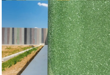
Gros plan sur le revêtement en « peau de sirène » des parements de béton.