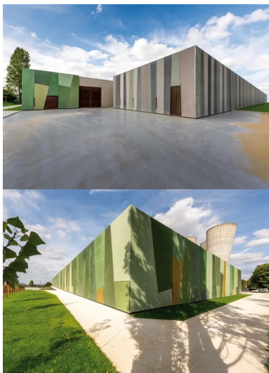
Angle nord-est du réservoir, quelques-uns des 356 panneaux de béton déclinés en 23 teintes.

Ce nouveau réservoir, le plus important du SEDIF, est entièrement construit avec un béton capable de résister à la fois aux fortes poussées provoquées par les 50 000 m 3 d'eau qu'il contient, aux corrosions des agents chimiques et au chlore utilisés pour potabiliser l'eau. Le béton a été coulé en voiles de 75 cm d'épaisseur et 12 m de hauteur, dont 6 m seulement apparents. En raison des longueurs de façades très importantes, plus de 100 m, les équipes de Bouygues TP ont mis en place des joints de dilatation de 2 cm, de type waterstop. Sur la face interne, afin d'amortir les efforts de poussées sur les parois, les angles des réservoirs sont arrondis, coulés en place grâce à un outil coffrant cintrable. Quant au radier, fractionné en huit plots de 400 à 800 m 3 de béton, réalisés en coulage continu, il a été dimensionné afin de résister aux poids des voiles béton de 12 m de hauteur, et aux efforts particuliers générés par la poussée de l'eau. Ainsi, l'épaisseur du béton du radier varie, passant de 70 cm sur les 20 m centraux, à 1 m d'épaisseur sur les 3 m périphériques.