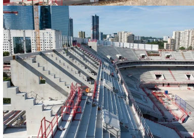
Gradins préfabriqués et portiques coulés en place.