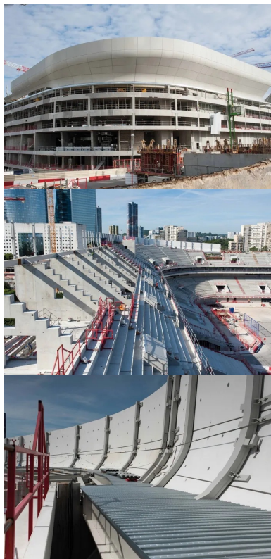
L'arena 92, et son couronnement de coques préfabriquées en béton de ciment blanc, réalisées par l'entreprise Jousselin (angers).

La partie immergée de l'ouvrage est complexe, car celui-ci est implanté au-dessus d'un véritable gruyère, et tient compte des futurs projets portés par l'Epadesa2 et RFF. Ainsi aujourd'hui, outre le passage en souterrain de l'autoroute A 14 au sud et au nord-ouest de la parcelle, le sous-sol sud-ouest est occupé par une usine de ventilation sur laquelle prend appui la superstructure de l'Arena ! Soletanche Bachy, qui a réalisé l'ensemble des travaux de fondations, a aussi modélisé et réservé le passage souterrain de la future ligne Eole. Le dimensionnement des 200 pieux, de 60 à 120 cm de diamètre, est fonction de la profondeur à laquelle ils prennent appui, jusqu'à 22 m pour les plus profonds, et des structures qu'ils supportent : gradins, voiles des bureaux, ou « pelouse » du stade. Les surcharges prévisibles, comme les spectateurs, et les aléas tels que le vent ont aussi été pris en compte pour leur dimensionnement. « Notre BE Structure a modélisé l'ensemble de l'opération afin de calculer tous les efforts point par point », précise encore le directeur des travaux. L'intervention de Soletanche Bachy a aussi porté sur la réalisation des parois de 20 à 25 cm d'épaisseur en béton projeté sur un treillis soudé et clouté de 6 à 7 m de hauteur, qui forme l'enceinte du sous-sol. Il comprend un niveau de parking de 480 places.