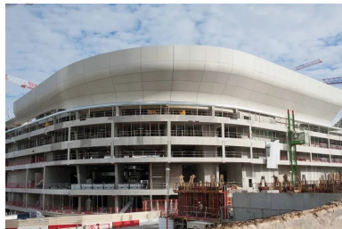
L'arena 92, et son couronnement de coques préfabriquées en béton de ciment blanc, réalisées par l'entreprise Jousselin (angers).

La partie immergée de l'ouvrage est complexe, car celui-ci est implanté au-dessus d'un véritable gryère, et tient compte des futurs projets portés par l'Epadesa2 et RFF. Ainsi aujourd'hui, outre le passage en souterrain de l'autoroute A 14 au sud et au nord-ouest de la parcelle, le sous-sol sud-ouest est occupé par une usine de ventilation sur laquelle prend appui la superstructure de l'Arena ! Soletanche Bachy, qui a réalisé l'ensemble des travaux de fondations, a aussi modélisé et réservé le passage souterrain de la future ligne Eole. Le dimensionnement des 200 pieux, de 60 à 120 cm de diamètre, est fonction de la profondeur à laquelle ils prennent appui, jusqu'à 22 m pour les plus profonds, et des structures qu'ils supportent : gradins, voiles des bureaux, ou « pelouse » du stade. Les surcharges prévisibles, comme les spectateurs, et les aléas tels que le vent ont aussi été pris en compte pour leur dimensionnement. « Notre BE Structure a modélisé l'ensemble de l'opération afin de calculer tous les efforts point par point », précise encore le directeur des travaux. L'intervention de Soletanche Bachy a aussi porté sur la réalisation des parois de 20 à 25 cm d'épaisseur en béton projeté sur un treillis soudé et clouté de 6 à 7 m de hauteur, qui forme l'enceinte du sous-sol. Il comprend un niveau de parking de 480 places.