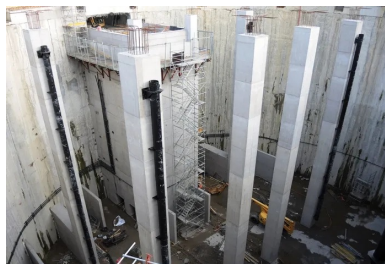
Deux des files de poteaux à l'intérieur du bassin de stockage.

Le deuxième lit a été retiré après la réalisation du radier et le premier après celle de la dalle intermédiaire. De ce fait, l'ensemble des voiles et des appuis constitutifs des différentes structures de l'ouvrage a dû être coulé en présence des deux lits de butons, ce qui a singulièrement compliqué les travaux en raison de l'exiguïté du chantier.