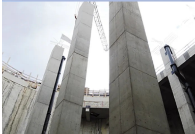
Les poteaux de 25 m de hauteur à l'intérieur du bassin de stockage.