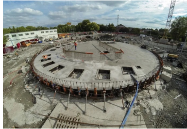
La dalle de couverture de la station.

Pour éviter les débordements dans le milieu naturel, Lille Métropole a engagé d'importants travaux pour augmenter ses capacités de stockage et de pompage. L'objectif est d'améliorer le transfert des eaux usées et pluviales vers la station d'épuration de Marquette-lez-Lille.