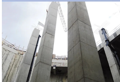
Les poteaux de 25 m de hauteur à l'intérieur du bassin de stockage.