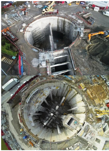
La station de pompage avec la bache de réception en partie centrale.