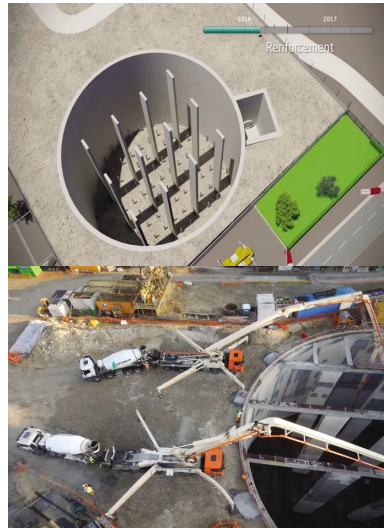
Avec 25 m de profondeur et 40 m de diamètre, la capacité du bassin est de 23 400 m 3 .

« Il s'agit d'un vaste conteneur en béton , vide, construit dans la profondeur du sous-sol et destiné à recevoir les excédents d'eau qui, s'ils n'étaient pas pris en compte, déborderaient sur la voirie », explique Didier Laplanche, chargé d'opérations à la direction de l'Eau du conseil départemental 92. Pour les « petites pluies » qui ne présentent pas de risque d'inondation, l'utilisation partielle et contrôlée du bassin permettra de réduire d'environ 40 % les volumes annuels rejetés dans la Seine par les déversoirs du secteur d'Issy-les-Moulineaux.