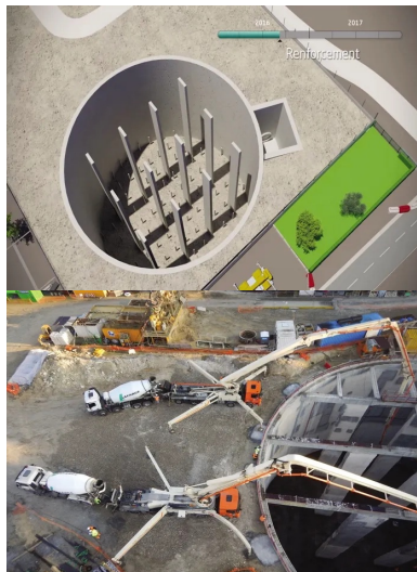
Avec 25 m de profondeur et 40 m de diamètre, la capacité du bassin est de 23 400 m 3 .

« Il s'agit d'un vaste conteneur en béton , vide, construit dans la profondeur du sous-sol et destiné à recevoir les excédents d'eau qui, s'ils n'étaient pas pris en compte, déborderaient sur la voirie », explique Didier Laplanche, chargé d'opérations à la direction de l'Eau du conseil départemental 92. Pour les « petites pluies » qui ne présentent pas de risque d'inondation, l'utilisation partielle et contrôlée du bassin permettra de réduire d'environ 40 % les volumes annuels rejetés dans la Seine par les déversoirs du secteur d'Issy-les-Moulineaux.