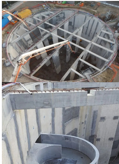
12 barrettes portent les poutres, supports de la couverture en béton.

vocation initiale. Sur le sol du stade seront tour à tour posés une couche (50 cm) d'agrégats de différentes granulométries, un revêtement fibré, du sable et des fragments de pneus recyclés et concassés pour assouplir le sol.