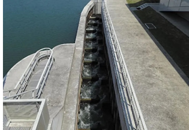
Passes à poissons à chambres successives dans les barrages de vives-eaux et Chatou.