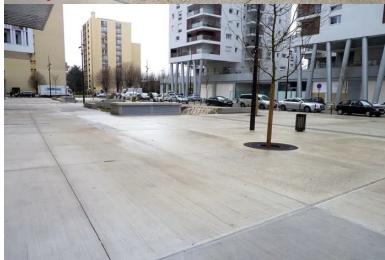
Trois types de bétons ont été retenus pour le revêtement de la place du Général-de-Gaulle : un béton brossé pour les zones piétonnes, un béton bouchardé, permettant le passage occasionnel de gros véhicules, et un béton hydrogommé pour la partie circulée de l'espace.