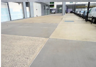
Partie piétonne de la place du Général-de-Gaulle. Un important calepinage a dessiné de grandes transversales et assuré une disposition équilibrée des joints de dilatation – couverts et non recouverts – et de retrait.