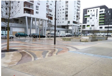
La place du Général-de-Gaulle, à Ivry-sur-Seine. Parmi les enjeux incontournables, la Ville souhaitait laisser une place à la voiture, en termes de stationnement comme de circulation.

S'appuyant sur l'orientation des bâtiments alentour – un large front bâti avec plusieurs percées –, la réflexion de l'équipe d'Urbicus s'oriente rapidement vers le dessin d'un espace monopenté au milieu duquel se succèdent trois grandes noues, plantées de végétaux appréciant les milieux humides, de type saule et autres graminées, qui permettent de récolter les eaux de ruissellement. « Selon la traduction que nous avions pu faire du cahier des charges de l'aménageur, en l'occurrence l'AFTRP (1), la place devait être la plus simple possible, à savoir surtout minérale, explique Rudy Blanc, l'architecte paysagiste ayant conduit le projet pour Urbicus. Elle devait aussi pouvoir accueillir des manifestations publiques. » Autre enjeu incontournable : la volonté de la municipalité de laisser une place à la voiture.