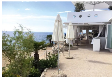
Vue de l'entrée du restaurant La Cigale Vista Beach, à Roquebrune-Cap-Martin.