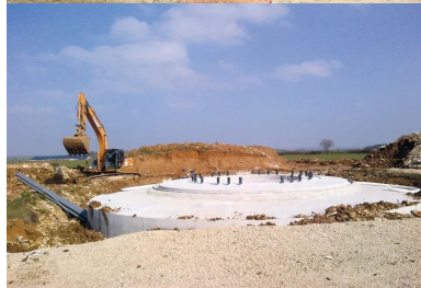
Un massif de fondation d'éolienne nécessite la mise en œuvre d'environ 400 m 3 de béton. Poids total : un millier de tonnes.