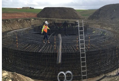
Mise en place du ferrailage par la Société d'armatures spéciales.