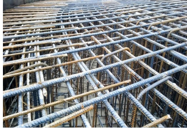
Mise en place du ferrailage par la Société d'armatures spéciales.

Trois ans d'études ont été nécessaires pour valider le projet éolien, analyser la topographie des lieux et la fréquence de leurs vents. L'examen des recours a également pris plusieurs années, avant que soit obtenu le feu vert juridique. Le parc comprend donc 27 éoliennes - de 102 m de hauteur et dotées d'un rotor de 82 m de diamètre -, ce qui en fait le plus important de Bourgogne. Le maître d'ouvrage, Enercon, constructeur des éoliennes, a confié le chantier de terrassement et des fondations à la société Etchart, une entreprise de génie civil et maritime, basée à La Rochelle. Cemex a été chargée de la fourniture et de la mise en place de la pompe du béton dans les massifs de fondation, dont le ferrailage, particulièrement technique, a été réalisé par la Société d'armatures spéciales, basée à Criquebeuf-sur-Seine (Eure).