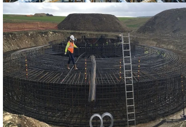
Mise en place du ferrailage par la Société d'armatures spéciales.