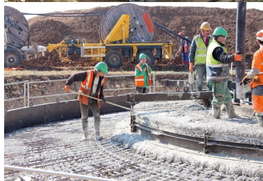
Pour réaliser les massifs de fondation des éoliennes, environ 100 kg d'armatures sont nécessaires par mètre cube de béton.