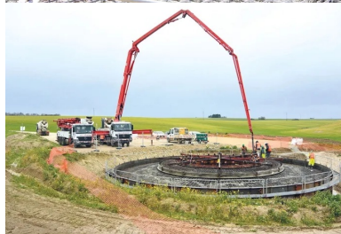
Opération de coulage du béton : le massif de fondation circulaire d'une E82/2300 mesure environ 9 m de rayon, soit 250 m 2 de surface.