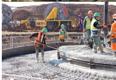
Pour réaliser les massifs de fondation des éoliennes, environ 100 kg d'armatures sont nécessaires par mètre cube de béton.