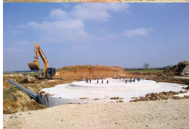
Un massif de fondation d'éolienne nécessite la mise en œuvre d'environ 400 m 3 de béton. Poids total : un millier de tonnes.