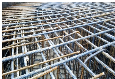
Mise en place du ferrailage par la Société d'armatures spéciales.

Trois ans d'études ont été nécessaires pour valider le projet éolien, analyser la topographie des lieux et la fréquence de leurs vents. L'examen des recours a également pris plusieurs années, avant que soit obtenu le feu vert juridique. Le parc comprend donc 27 éoliennes - de 102 m de hauteur et dotées d'un rotor de 82 m de diamètre -, ce qui en fait le plus important de Bourgogne. Le maître d'ouvrage, Enercon, constructeur des éoliennes, a confié le chantier de terrassement et des fondations à la société Etchart, une entreprise de génie civil et maritime, basée à La Rochelle. Cemex a été chargée de la fourniture et de la mise en place à la pompe du béton dans les massifs de fondation, dont le ferrailage, particulièrement technique, a été réalisé par la Société d'armatures spéciales, basée à Criquebeuf-sur-Seine (Eure).