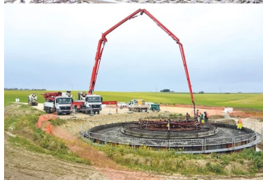
Opération de coulage du béton : le massif de fondation circulaire d'une E82/2300 mesure environ 9 m de rayon, soit 250 m 2 de surface.