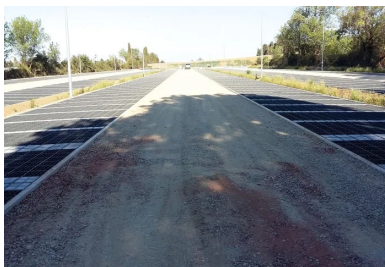
Pour accueillir les futurs clients du village des marques de Miramas, AER a réalisé les bordures des parkings en béton extrudé (17 cm de haut, 10 cm de large).

Une troisième et dernière intervention est programmée : « Ce sera fin septembre, avec une petite machine, pour finaliser les bordures en périphérie, soit environ 3 600 mètres linéaires supplémentaires. »