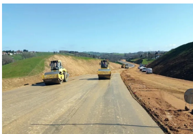
Le tronçon 2 x 2 voies sur 4,5 km implique la création d'une plate-forme de 25 m, qui nécessite environ 700 000 m 3 de terrassement. Au total, l'opération une fois achevée se soldera par le traitement de 115 000 m 2 de couche de forme au liant hydraulique routier.

À cet endroit précis, la création d'une 2 x 2 voies sur 4,5 km, avec une largeur de plate-forme de 25 m, implique de réaliser environ 700 000 m 3 de terrassement. Au total, l'opération se traduira par le traitement de 115 000 m 2 de couche de forme au liant hydraulique routier (LHR). Liant choisi : le LV TS 03, produit par la cimenterie Vicat de Créchy (Allier). Un choix logique, selon la DIR Centre-Est : « Il s'agit d'une technique classique, mais avec des conditions de mise en œuvre particulières, précise Julien Champeymond. Une analyse géotechnique globale, réalisée sur l'ensemble du tracé, a permis de trouver, dans les déblais de la partie nord, un gisement important de matériaux qui se prêtent bien au traitement au liant hydraulique. Du coup, il était plus pertinent de traiter ce que l'on a trouvé sur place plutôt que de faire venir des matériaux de l'extérieur pour obtenir les résistances mécaniques que nous souhaitons. »