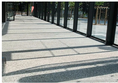
La coursière en béton bouchardé prolonge le parvis à l'intérieur du bâtiment.

« Le chantier a commencé en octobre 2013, mais nos interventions en béton décoratif se sont concentrées dans les quelques mois qui ont précédé la fin du chantier en mai 2016, note de son côté Dominique Noraz, chef de l'agence Sols-Aquitaine. Pour les finitions désactivées, hydrosablées et bouchardées, nous avons utilisé une formule de type C25/30 XF2 S3, avec un mélange de deux agrégats (50 % chacun) possédant la même granulométrie : le premier est un caillou à dominante gris bleuté (10/14C Gris des Pyrénées) et le second, plutôt vert, est une diorite de Thiviers (Périgord). Le ciment est celui de Lafarge Ciment, produit sur le site de La Couronne. Il est de type CEMIIA-LL 42,5R CP2. Cette formule a été fabriquée par Lafarge Béton à Lormont (soit à 3 km du chantier). En ce qui concerne les formules pour les bétons lisses, nous avons utilisé un béton normé de type C25/30 avec un dosage réel de ciment à 350 kg. Au total, nous avons mis en œuvre environ 500 m3 de béton décoratif : cela représente plus de 3 000 m2 d'aménagements sur un site qui est relativement contraint en termes de surface totale au sol, vu les équipements proposés, mais qui donne paradoxalement une réelle sensation d'espace... »