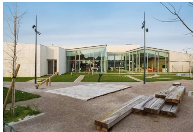
À l'arrière, les salles transparentes de la médiathèque semblent incluses dans le jardin.

Édifiée à la convergence des trois cités, créant un lien matériel et visuel, elle achève de donner une centralité, là où auparavant se trouvait un terrain vacant. Équipement public original, elle rassemble des fonctions traditionnellement éparées – services municipaux, café, salle de spectacle, etc. Dans un même bâtiment, les visiteurs peuvent passer du temps à consulter un livre, un journal, tout en attendant un rendez-vous à la PMI et en buvant un café ou une « Page 24 », une bière locale au nom prédestiné. Parce qu'elle est incluse au milieu d'autres activités, éventuellement soutenue par des animations, la lecture devient accessible à tous. C'est du moins le pari qui est fait là.