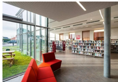
Salle de lecture et d'écoute de la médiathèque entièrement vitrée sur le jardin. Les poteaux en béton implantés en retrait de la façade, signalent la structure.

Les trois volumes qui se déploient en éventail à l'arrière du premier contiennent respectivement la médiathèque et les ateliers, les bureaux de services sociaux et une salle réservée aux enfants, la salle de diffusion pouvant accueillir aussi bien des réunions, des conférences que des spectacles ou des expositions. Les façades sud des deux premiers sont vitrées sur le jardin aménagé à l'arrière. La salle de diffusion, différenciée depuis l'extérieur par son volume angulé habillé de tôles d'acier laqué perforées, peut, selon son programme, occulter toute lumière extérieure ou bien s'ouvrir complètement sur l'estaminet ou encore partiellement sur le parvis nord-ouest. La partie organisée en ateliers – cuisine, musique, etc. – peut communiquer directement avec la médiathèque ou, à l'inverse, s'en isoler pour accueillir des usagers directement depuis la rue Louis Legay. Toute la parcelle est occupée, entre le bâtiment, le parvis et le jardin.