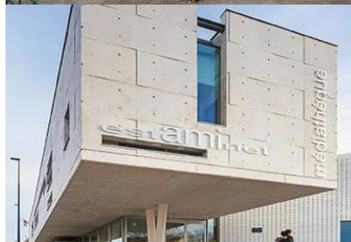
Pignon ouest. sa faille vitrée permet d'éclairer le bureau qu'il abrite. en porte-à-faux au-dessus du parvis, il définit une surface extérieure de transition dans le prolongement de l'espace des périodiques et de l'estaminet.