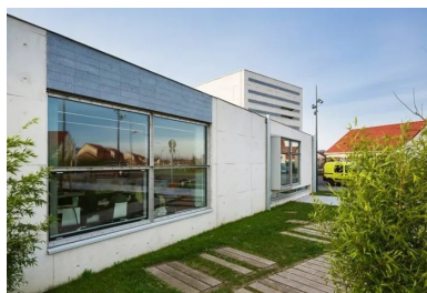
Façade orientée à l'est, à l'abri de la circulation.

Le soutien de la région Nord-Pas-de-Calais a été déterminant, tant sur le plan financier (80 % du budget) que pour le montage du projet qui aura pris trois ans. Toutes les étapes du projet se sont déroulées en concertation avec les élus, mais aussi avec les habitants, invités régulièrement à participer à des réunions d'information puis à suivre le déroulement du chantier et jusqu'à l'inauguration à laquelle tous étaient conviés ; 4 000 personnes étaient présentes. Depuis, ouverte 6 jours sur 7 à raison de 44 heures hebdomadaires, la médiathèque accueille en moyenne 200 personnes par jour de tous âges et de toutes origines ! Le nombre d'inscrits comme de prêts a explosé. Elle a reçu le prix de l'accueil au Grand Prix Livres Hebdo 2015 de bibliothèques francophones.