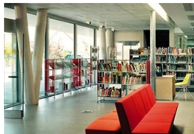
Hall d'entrée où s'avance la salle de lecture. Le plafond béton, correspond à la partie du bâtiment de deux niveaux. une faille vitrée marque la transition avec la partie de plain-pied.

Par ailleurs, l'association de la massivité du béton, de l'étanchéité des terrasses végétalisées avec la transparence et la finesse des façades en verre permet d'obtenir une inertie thermique importante et d'assurer la conformité à la RT 2012. Le confort d'été comme d'hiver est assuré, tout en privilégiant l'éclairage naturel.