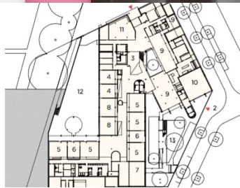
Plan de rez-de-chaussée: 1. Entrée principale 2. Accès salle de sport 3. Hall 4. Centre de loisirs 5. Classes maternelles 6. Ateliers 7. Salle de motricité 8. Salles de repos 9. Salles à manger 10. Salle de sport 11. Bibliothèque 12. Cour maternelle 13. Jardin