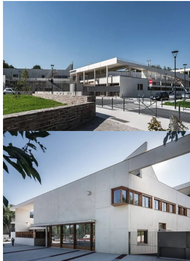
Angle sud-est. la salle de sport dispose d'une entrée en relation directe avec la rue, côté sud, afin de pouvoir servir aussi indépendamment de l'école.

Pour respecter cet objectif, le plan d'urbanisme dessiné par l'agence Ellipse, associée à l'atelier de paysage Jacqueline Osty, s'appuie sur ces lignes fluctuantes dessinées par les haies, préserve les zones humides et met en place un réseau de récupération des eaux de pluie à ciel ouvert. La place réservée à la circulation automobile est réduite au profit d'une trame verte et de cheminements piétons et cyclistes. Les immeubles résidentiels et de bureaux s'organisent en plot ou plot allongé, atteignant désormais jusqu'à neuf étages ; la densité a dû être augmentée pour répondre à l'arrivée de nouvelles populations.