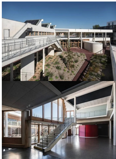
Le jardin met à distance la voie publique des salles de cours. le volume ovoïde en avant de la façade sud délimite l'entrée particulière de la salle de sport.

Les menuiseries en bois de la façade vitrée du rez-de-chaussée, placée en retrait , révèlent par effet de contraste le béton clair de la façade en drapeau. Puis, la cour des classes maternelles le long de la façade ouest est visible à travers la grille. De ce côté, la parcelle est bordée par un talus.