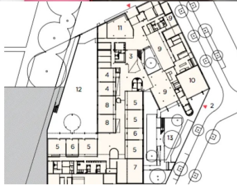
Plan de rez-de-chaussée: 1. Entrée principale 2. Accès salle de sport 3. Hall 4. Centre de loisirs 5. Classes maternelles 6. Ateliers 7. Salle de motricité 8. Salles de repos 9. Salles à manger 10. Salle de sport 11. Bibliothèque 12. Cour maternelle 13. Jardin