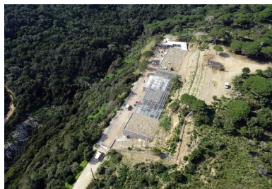
La toiture en partie végétalisée avec des espèces locales, complète l'intégration.

Par ailleurs, pour des raisons d'accès (la route est très étroite), tous les panneaux préfabriqués du « sarcophage » ont été coulés sur le chantier.