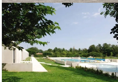
La piscine d'été dans le paysage naturel.