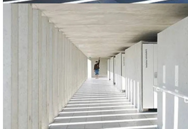
Le parcours allant de l'entrée à la baignade est organisé dans une marche en avant à travers une galerie pleine de lumière éclairée naturellement par le claustra.