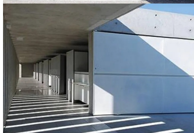
Le parcours allant de l'entrée à la baignade est organisé dans une marche en avant à travers une galerie pleine de lumière éclairée naturellement par le claustra.