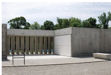
Le claustra en béton règle les relations entre intérieur et extérieur.

« Les bâtiments d'accueil, de vestiaires et le snack présents sur le site avaient le charme des « bons bâtiments » des années 60 mais ne pouvaient pas être adaptés correctement et conservés. Leur échelle mesurée, leur relation à la lumière naturelle, la simplicité des matériaux et la couleur bleue sont restées dans la conception de notre projet. À cela s'ajoute notre volonté de remettre la piscine d'été en relation avec les qualités du site, notamment le vallon de l'Aigubelle qui contient la bastide de Saint-Lys sur son autre rive », souligne Benjamin Van Den Bulcke de l'atelier ATP.