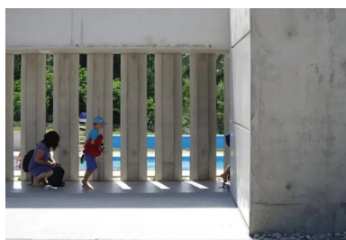
Le parcours allant de l'entrée à la baignade est organisé dans une marche en avant à travers une galerie pleine de lumière éclairée naturellement par le claustra.

En référence aux volets des anciens bâtiments, les profondeurs des cours/patios de l'accès et du snack sont accentuées par des aplats de peinture bleue. L'ensemble est construit en béton armé coulé en place. La réalisation du grand claustra de 38 m de long a fait l'objet d'une attention particulière au niveau de sa préparation, de sa mise en œuvre et de son décoffrage . Avec sa faible hauteur, le bâtiment trouve aisément sa place dans le site. Les arbres le dominent. Son architecture affirmée et contemporaine semble avoir été toujours présente dans le paysage.