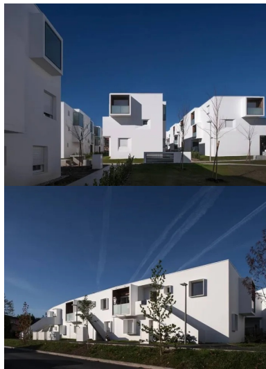
Dans l'alignement des immeubles de l'îlot Jouanicot, le traitement des loggias évite les vues en vis-à-vis.

Entre Bayonne et Biarritz, l'incessant mouvement de la voie routière du BAB (Bayonne Anglet-Biarritz) et son chapelet d'emprises commerciales ont joué leur rôle dans l'urbanisation d'Anglet, caractérisée par une densité relativement faible sur un territoire très étendu. Lotissements, habitat collectif et maisons individuelles se côtoient au fil de quartiers morcelés, pas toujours bien identifiés. L'opération Jouanicot Truillet portée par Habitat Sud Atlantic, qui réunit 72 logements locatifs et 13 logements en accession sociale, vient conforter un quartier proche du BAB.