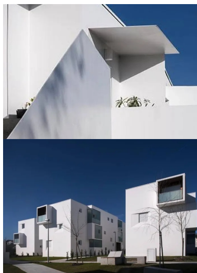
Le graphisme des escaliers en béton préfabriqué.

Implanter un parking de 120 places était une autre question fondamentale car un parking aérien aurait mis à mal les ambitions paysagères. « Faisant du sous-sol l'ouvrage le plus complexe de cette opération, le parking est donc sous le jardin », poursuit l'architecte. « Sa trame différant de celle des logements, il est coiffé par un plancher de reprise , intégrant des poutres en béton très surdimensionnées, qui offre un sol aux logements et supporte la terre du jardin. »