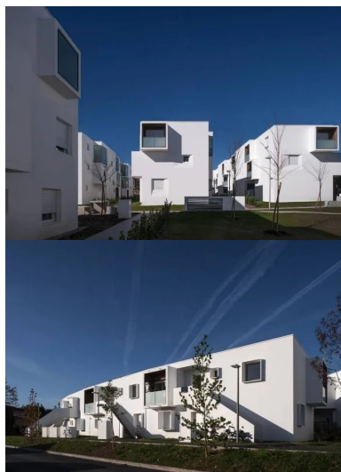
Dans l'alignement des immeubles de l'îlot Jouanicot, le traitement des loggias évite les vues en vis-à-vis.

Entre Bayonne et Biarritz, l'incessant mouvement de la voie routière du BAB (Bayonne Anglet-Biarritz) et son chapelet d'emprises commerciales ont joué leur rôle dans l'urbanisation d'Anglet, caractérisée par une densité relativement faible sur un territoire très étendu. Lotissements, habitat collectif et maisons individuelles se côtoient au fil de quartiers morcelés, pas toujours bien identifiés. L'opération Jouanicot Truillet portée par Habitat Sud Atlantic, qui réunit 72 logements locatifs et 13 logements en accession sociale, vient conforter un quartier proche du BAB.