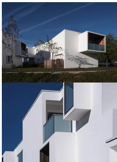
Conjuguant la quiétude et la recherche des vues, les maisons se déhanchent.

Sur le plan structurel, voiles de refend et planchers sont en béton coulé en place. Une attention particulière a été apportée à la suppression des ponts thermiques. Le principe général consiste à créer une rupture entre les éléments structurels en béton et les façades en créant un vide qui est rempli avec un isolant thermique. Les bâtiments sont isolés par l'intérieur. Ceci préserve, à l'extérieur, l'aspect du matériau, choix plastique qui donne une unité et une belle uniformité aux façades peintes en blanc. Cet ensemble est labellisé Bâtiment Basse Consommation (RT 2005).