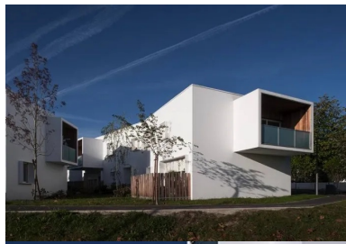
Conjuguant la quiétude et la recherche des vues, les maisons se déhanchent.

Sur le plan structurel, voiles de refend et planchers sont en béton coulé en place. Une attention particulière a été apportée à la suppression des ponts thermiques. Le principe général consiste à créer une rupture entre les éléments structurels en béton et les façades en créant un vide qui est rempli avec un isolant thermique. Les bâtiments sont isolés par l'intérieur. Ceci préserve, à l'extérieur, l'aspect du matériau, choix plastique qui donne une unité et une belle uniformité aux façades peintes en blanc. Cet ensemble est labellisé Bâtiment Basse Consommation (RT 2005).