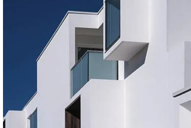
Découpe des fenêtres et des avancées.