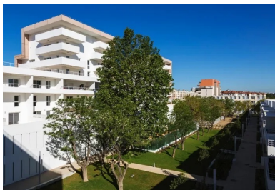
Marqué par un béton teinté le long du boulevard, le bâti est caractérisé par sa blancheur sur le cœur d’îlot.

À Marseille, le long du très passant boulevard Schloesing, à proximité immédiate du Vélodrome, cette nouvelle opération de logements s’inscrit dans le dispositif de reconstitution urbaine et architecturale du patrimoine de la SNI. Le groupe SNI, société nationale immobilière, filiale de la Caisse des dépôts et consignations, gère aujourd’hui 275 000 logements sur l’ensemble du territoire français, parmi lesquels ceux réservés aux militaires. C’est le cas de la présente opération qui jouxte des terrains de l’armée de terre à l’est et devra notamment permettre d’accueillir les soldats qui y sont mobilisés et leur famille.