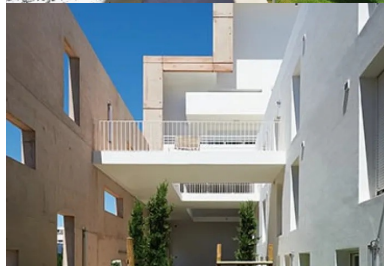
Derrière ce mur, les coursives d'accès aux logements sont particulièrement soignées pour faire du moment du « rentrer chez soi », un temps d'exception.