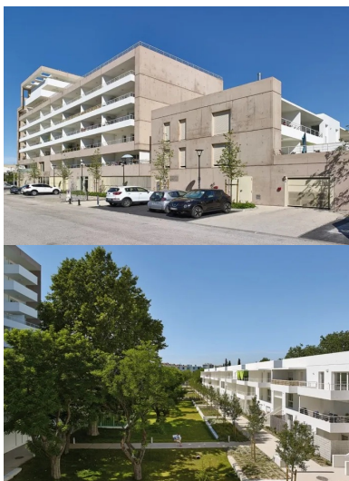
Le long de l’avenue des tirailleurs, le bâti marque un épannelage dégressif passant du r+8 au r+2.

L’ensemble s’implante en trois corps de bâti qui bordent les limites du site en marquant un épannelage d’ouest en est, du boulevard vers les terrains militaires. La composition générale forme une équerre bâtie le long du boulevard Schloesing et de l’avenue des Tirailleurs au sud, alors que le troisième corps est constitué d’un linéaire poreux de petits plots en R+2. Si la volumétrie est simple, la qualité architecturale et urbaine a permis d’offrir une grande diversité dans la façon d’accéder jusqu’à son logement.