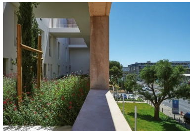
Le mur en béton teinté, le long du boulevard, crée un écran à la fois acoustique et visuel.

De jour et à la vitesse du piéton, le traitement architectural devient plus subtil, le long du boulevard Schloesing, les murs ont été réalisés en béton teinté dans la masse puis poncé. Ils offrent à la vue une patine naturelle et pérenne dans le temps, qui saura résister aux salissures induites par l'infrastructure. L'intérieur de l'îlot, en revanche, est caractérisé par la pureté d'un béton architectonique qui a reçu une peinture minérale blanche. Pour accentuer encore l'impression de sérénité de ce cœur d'îlot, les détails y ont été particulièrement soignés. Les aspects de surface ont été travaillés avec des finitions lisses, mates et brillantes pour que la peau du béton devienne vibrante sous le soleil. Le soin apporté aux détails d'exécution et le niveau de finition sont notables, soulignant la maîtrise d'une pratique particulière et d'une exécution partagée avec les entreprises ; ultimes mises au point d'une opération de logements remarquable à la fois en matière d'insertion urbaine, de qualités architecturales et d'usages pour les habitants.