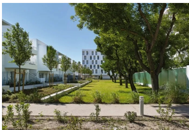
Le cœur d’îlot est remarquable par la conservation des arbres majestueux existants : platanes et alignements d’acacias.

Enfin, la limite parcellaire partagée avec les terrains militaires est constituée de logements intermédiaires en R+2 qui composent un ensemble plus domestique et préservent également les vues vers le grand paysage que compose la chaîne Saint-Cyr. Le principe de desserte à ciel ouvert permet de privatiser les accès aux habitations et de préserver des transparences vers le cœur d’îlot.