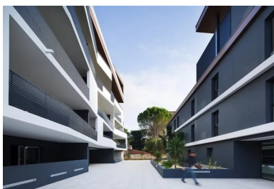
Le parvis entre les deux bâtiments crée un socle commun.

La trame structurelle très rationnelle suit le plan rectangulaire des immeubles avec des circulations verticales comme noyaux de contreventement, des refends en fond de loggia, recoupés par des refends porteurs. Des poutres voiles reprennent les encorbellements et les séparatifs entre logements. Tous les éléments de cette structure sont en béton banché et, comme pour les attiques et les loggias, coulé sur place. Prix national de l'esthétique immobilière, l'opération est certifiée haute qualité environnementale (HQE) et labellisée bâtiment basse consommation (BBC Effinergie).