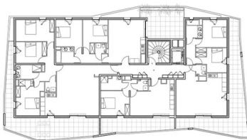
Plan d'étage courant du bâtiment haut