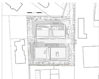
Plan des niveaux