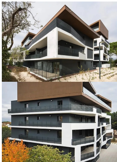
Angle sud du bâtiment bas. les loggias s'ouvrent sur l'extérieur de l'opération et bénéficient de la même orientation sud-ouest que celles du bâtiment haut.

Trois halls d'entrée correspondent aux trois hauteurs et aux trois types de logement. Les deux plus hauts bénéficient d'un ascenseur, le plus bas uniquement d'une cage d'escalier. Deux niveaux de sous-sol, partagés entre parkings et caves (à chaque appartement correspond une cave), s'étendent sur l'ensemble de la parcelle.