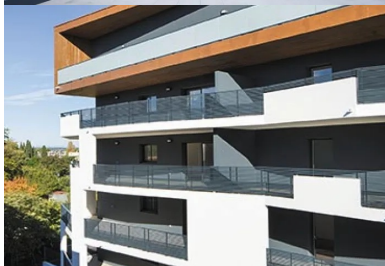
Façade principale du bâtiment haut avec ses grandes loggias orientées sud-ouest dont les rives en béton peint en blanc soulignent le dépiement.