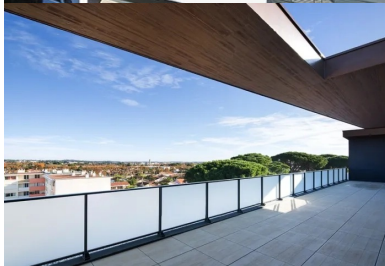
Vue panoramique depuis une terrasse du dernier étage, cadrée par la toiture de l'attique.