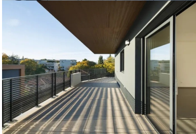
Vaste terrasse partiellement protégée par le porte-à-faux de l'attique qui fait brise-soleil. La matrice du béton et sa lasure brune s'accordent aux pins parasols.