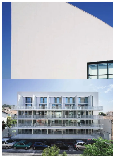
Médiathèque Hugo Pratt, Courmon L'Auvergne. Autre exemple - marquant - de réponse architecturale aux contraintes de sismicité de niveau 3.