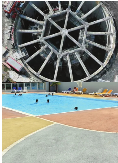
Bassin d'orage de Chaudé Rivière, Communauté urbaine de Lille. Cet ouvrage de lutte contre les inondations se compose de deux bassins circulaires en béton, reliés par un canal de surverse de l'un vers l'autre.