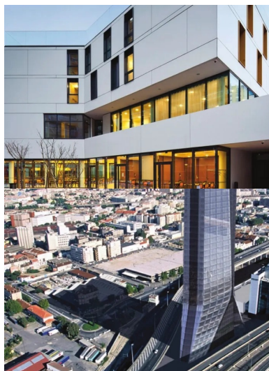
Maison de retraite EPHAD Annie Girardot, Paris. Ce projet, pilote pour la mise au point du référentiel de certification Habitat & Environnement EHPAD, porte une attention particulière au confort et à l'accessibilité des occupants, population qui doit pouvoir disposer d'un temps d'évacuation adapté à ses vulnérabilités.