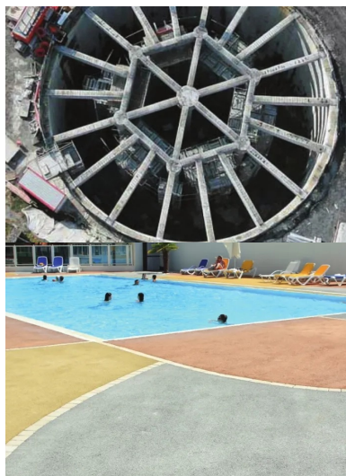
Bassin d'orage de Chaudé Rivière, Communauté urbaine de Lille. Cet ouvrage de lutte contre les inondations se compose de deux bassins circulaires en béton, reliés par un canal de surverse de l'un vers l'autre.