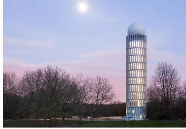
Haut de 57 m, le fût cylindrique de la tour radar se compose de 308 claires-voies ouvrant en partie basse sur le paysage et en partie haute sur le ciel et ses variations.

Composée d'éléments préfabriqués en béton, la tour radar imaginée par les architectes Barthélémy & Griño s'élève comme un signal dans le paysage du plateau de Saclay.