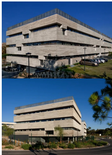
Angle est. Les panneaux des façades périphériques en béton brut de décoffrage contribuent au caractère moderne de l'édifice. Le fonctionnement intérieur est invisible depuis l'extérieur.

L'ensemble de ces exigences vise à créer des conditions de travail et de confort optimums. Et si l'on en croit Olivier Calderon, la qualité visée et obtenue explique en partie la très grande stabilité des salariés : avec la croissance de l'entreprise, de nouveaux arrivent mais rares sont ceux qui partent.