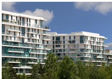
Le bâtiment est habillé d'éléments verriers dont les nuances de vert rappellent le parc qui lui fait face.