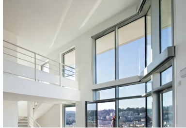
duplex dont les grandes baies vitrées, toute hauteur, ouvrent sur le paysage.