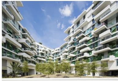
À l'intérieur de l'îlot, le foisonnement des balcons forme un paysage vertical qui envahit les façades.