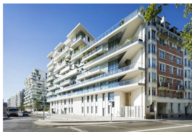
sur l'avenue Lefaucheux, les balcons filants en béton blanc accompagnent l'étiement horizontal du bâtiment.