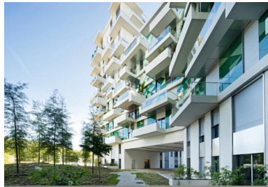
Les allées et passages en porche permettent une circulation libre à l'intérieur de l'îlot.

Inscrit dans une démarche de labellisation bâtiment basse consommation (certification H&E profil A), le travail sur l'orientation des appartements et leur agencement – ils sont tous différents – a permis d'optimiser les apports de lumière. A la structure classique en béton coulé en place, combinant poutres et refends, est associé un système d'isolation par l'extérieur, revêtu des éléments verriers ou enduït dans les parties hautes et basses. Des panneaux solaires thermiques placés en toiture contribuent également à réduire les consommations énergétiques.