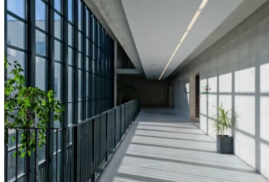
Les circulations sont organisées autour du hall, mis en scène en grand atrium central. Il permet d'embrasser la véritable échelle du bâtiment.