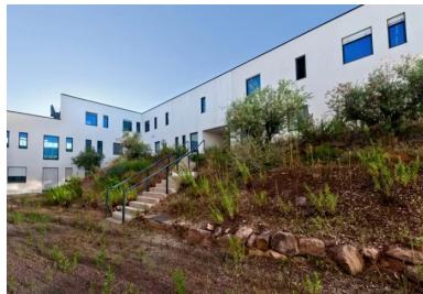
À l'intérieur, un vaste patio central permet de faire entrer la lumière naturelle dans les locaux.