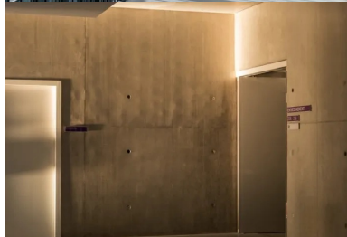
La présence intérieure du béton favorise la pérennité du bâtiment et l'inertie thermique.