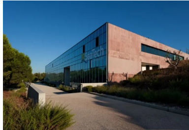
La façade principale, ouverte au nord, est totalement vitrée et animée d'une signalétique surdimensionnée.

Ce parti est d'autant plus important que la communauté d'agglomération de Toulon Provence Méditerranée, maître d'ouvrage de l'opération, souhaitait que les candidats architectes développent au travers du projet de la future école une réflexion plus globale et à grande échelle pour offrir une « image valorisante » au pôle technologique. Partant de cette idée de mise en scène du paysage, l'agence d'architecture propose d'installer l'ensemble des futures entités à flanc de colline en s'appuyant sur les ondulations naturelles de celle-ci. L'ensemble forme un chapelet de bâtiments organisés dans une composition géométrique commune. Cette posture crée une homogénéité volumétrique pour l'ensemble du campus tout en permettant à chaque bâtiment d'avoir sa propre identité. Depuis l'autoroute, le pôle technologique offre un repère simple, efficace et visible : une « guirlande » de bâtiments qui serpente en pied de colline boisée. Les toitures de ces bâtiments ancrés dans la pente offrent des activités complémentaires sur les toits, comme des belvédères auxquels on accède les sentiers existants pour profiter des paysages lointains.