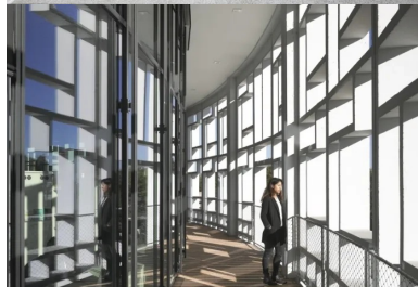
La peau vitrée placée en retrait des claustras engendre aux premier et second étages une coursive circulaire.