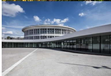
La façade largement vitrée de l'extension rend visible de l'extérieur ce qui se passe dans le bâtiment et invite à entrer.