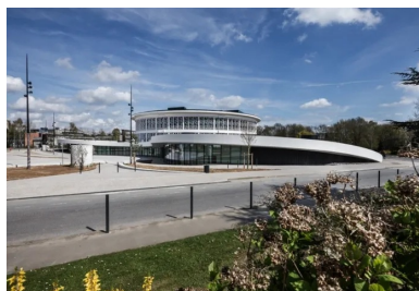
L'acrotère blanc en béton dessine un renforcement qui libère au sol un vaste parvis.

Le bâtiment d'origine a fait l'objet d'une réorganisation et d'une rénovation complète. La coupole en pavés de verre, qui dominait le cœur de l'édifice, est remplacée par une verrière contemporaine lumineuse, disposée à un niveau plus élevé. Elle éclaire ainsi un espace formant un atrium intérieur généreux, véritable foyer spatial de Lilliad. L'ondulation de l'extension, soulignée par son acrotère blanc en béton, dessine un renforcement qui libère au sol un vaste parvis. L'ondulation de l'extension, soulignée par son acrotère blanc en béton, dessine un renforcement qui libère au sol un vaste parvis ouvert en direction du cœur de la vie étudiante du campus, où sont regroupés l'espace culturel et la maison des étudiants. L'entrée du Learning Center Innovation donne sur le parvis. La façade largement vitrée de l'extension rend visible de l'extérieur ce qui se passe dans le bâtiment et invite à entrer.