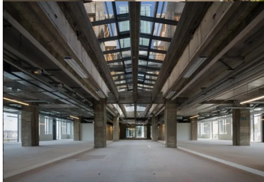
Au cœur de l'édifice, un patio triple hauteur, créé par la suppression de 4 000 m 2 de planchers, assure une réponse environnementale en termes de ventilation, de rafraîchissement, de désenfumage et de lumière naturelle.