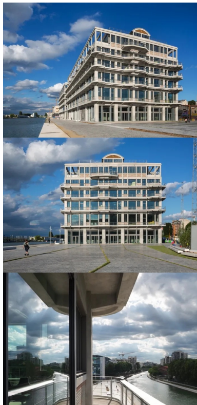
1 400 m de coursives ceinturent l'imposante structure sur ses quatre faces.

La lumière naturelle pénètre dans l'épaisseur du bâtiment par les façades extérieures, mais aussi par les puits de lumière du patio planté créé dans les niveaux supérieurs. Celui-ci a impliqué la déconstruction de près de 4 000 m 2 de surface de plancher. Porté grâce à la relation de confiance qui lie BETC et Jung Architectures depuis quinze ans, ce « sacrifice » a permis la création d'espaces ouverts et lumineux où tout est fait pour encourager les rencontres spontanées. Ainsi, derrière des façades intérieures en mélèze, de multiples espaces permettent aux occupants de travailler ensemble dans l'environnement qu'ils souhaitent en multipliant les circulations et les points de convergence. Enfin, le cinquième étage a été en partie démantelé pour accueillir un jardin en pleine terre. Tout en assurant des refuges pour les insectes et les oiseaux, les poutres de structure forment aujourd'hui une immense pergola sous laquelle il fait bon travailler ou se détendre.