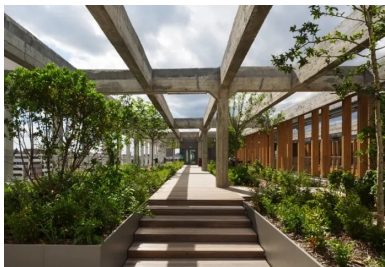
En partie démantelé, le dernier niveau accueille un jardin en pleine terre.

Ainsi, autrefois pensés comme une plateforme logistique vouée au transfert des marchandises, les magasins généraux abritent aujourd'hui une activité humaine permanente. Abritée par l'imposante structure, une population nomade et connectée y officie en fonction de ses besoins et de ses occupations, en profitant du paysage de la périphérie en mutation. Dans vingt ans, on sera à Paris.