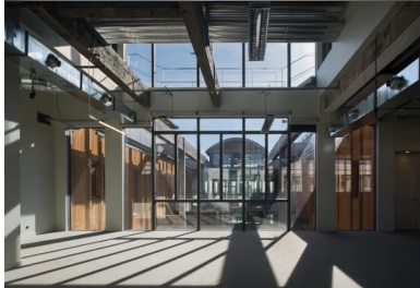
Au cœur de l'édifice, un patio triple hauteur, créé par la suppression de 4 000 m 2 de planchers, assure une réponse environnementale en termes de ventilation, de rafraîchissement, de désenfumage et de lumière naturelle.