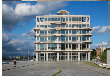
des places et une promenade agrémentées de jardins accompagnent le bâtiment.