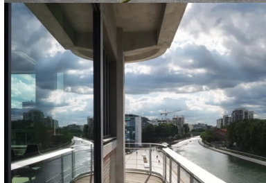
Des vues sur le grand Paris à tous les étages.