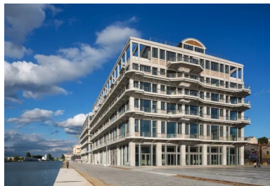
1 400 m de coursives ceinturent l'imposante structure sur ses quatre faces.

La lumière naturelle pénètre dans l'épaisseur du bâtiment par les façades extérieures, mais aussi par les puits de lumière du patio planté créé dans les niveaux supérieurs. Celui-ci a impliqué la déconstruction de près de 4 000 m 2 de surface de plancher. Porté grâce à la relation de confiance qui lie BETC et Jung Architectures depuis quinze ans, ce « sacrifice » a permis la création d'espaces ouverts et lumineux où tout est fait pour encourager les rencontres spontanées. Ainsi, derrière des façades intérieures en mélèze, de multiples espaces permettent aux occupants de travailler ensemble dans l'environnement qu'ils souhaitent en multipliant les circulations et les points de convergence. Enfin, le cinquième étage a été en partie démantelé pour accueillir un jardin en pleine terre. Tout en assurant des refuges pour les insectes et les oiseaux, les poutres de structure forment aujourd'hui une immense pergola sous laquelle il fait bon travailler ou se détendre.