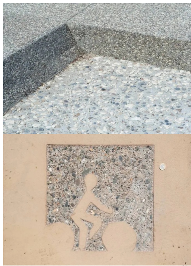
Des bordures inclinées pour une transition douce entre trottoirs et voirie.