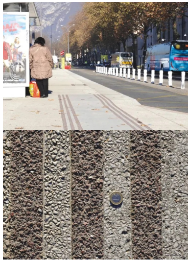
Des bandes rugueuses de couleur grenat, créées sur le béton désactivé, signalent la présence de voies cyclables.