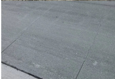
Les amorces sont réalisées tous les 120 cm.