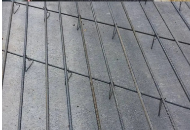
disposées tous les 170 mm, les armatures longitudinales ont un diamètre de 20 mm. Espacées de 700 mm, les armatures transversales (12 mm de diamètre) les croisent selon un angle de 60°.