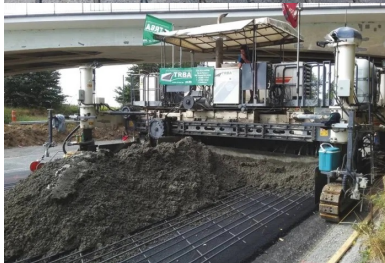
Le nu supérieur des barres longitudinales des armatures se situe entre 80 et 100 mm de la surface du revêtement ni.