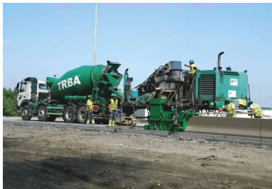
Sur le nouveau tronçon, 18 500 m de dispositifs de retenue en béton ont été coulés en place.

Les granulats : du 4/6 en surface « La granulométrie choisie était de 0/20 avec un dosage de 25 % de granulats 4/6, explique André Jasienski. Au moment de la vibration , les granulats de plus gros calibre descendent légèrement. Il ne reste alors en surface que les granulats de calibre 4/6, qui sont en léger surdosage. La mise en valeur du granulats 4/6 confère au BAC sa planéité et son confort au niveau du bruit, tout en garantissant une adhérence parfaite grâce à la qualité de la pierre (du porphyre). Dans vingt ans, ces granulats auront toujours la même adhérence qu'aujourd'hui. Avantage : le porphyre est une pierre de grande qualité, facilement disponible en Belgique. C'est un matériau local et qui ne présente pas de surcoût élevé. »