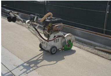
Des amorces de fissuration ont été réalisées par sciage au plus vite après le dénuçage. But : le développement rapide de fissures plus droites et régulières, réduisant le risque de regroupement.

Les armatures : situées entre 8 et 10 cm de la surface du béton Elles sont indispensables à la réalisation du BAC : elles lui confèrent sa continuité et doivent être de bonne qualité. Le diamètre des armatures longitudinales est de 20 mm, celui des armatures transversales de 12 mm, avec un écartement entre les axes des armatures longitudinales de 170 mm. La nappe d'armature est positionnée pour se situer entre 8 et 10 cm de la surface du béton, légèrement au-dessus de la fibre neutre. Le rôle de cette armature est de contrôler la fissuration du béton lors de son retrait . Les fissures ont généralement une ouverture de l'ordre de 0,3 mm et ne laissent pénétrer ni l'eau ni les sels de déverglaçage.