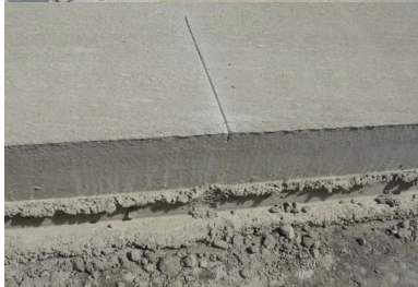
Les amorces mesurent 40 cm de longueur.