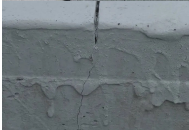
Profondeur : 4 cm.