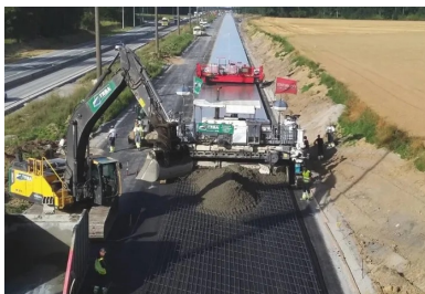
La nouvelle autoroute E42/A8 Kain-Lamain a nécessité la pose de 230 000 m 2 de BAC.