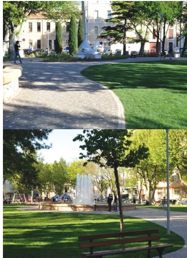
Réalisés en béton désactivé (avec granulats roulés de Durance), les cheminements du square Charles-de-Gaulle de Salon-de-Provence sont cloutés de petits pavés calcaires.

Oui, le béton décoratif a su répondre aux souhaits des municipalités successives. Désormais, après le béton désactivé , nous marquons une nette préférence pour le béton bouchardé . Après des bétons très clairs, nous nous orienterons sans doute vers des bétons un peu plus sombres, en développant la végétalisation. Et nous devons être très attentifs à préserver maintenant ce nouveau patrimoine, notamment du point de vue de l'esthétique, en l'entretenant soigneusement. Salon-de-Provence possède un passé prestigieux, mais je pense qu'elle a plus d'avenir que de passé. Nous avons un outil formidable ! Salon-de-Provence mérite d'être valorisée et, en tant que maire, je m'y emploie.