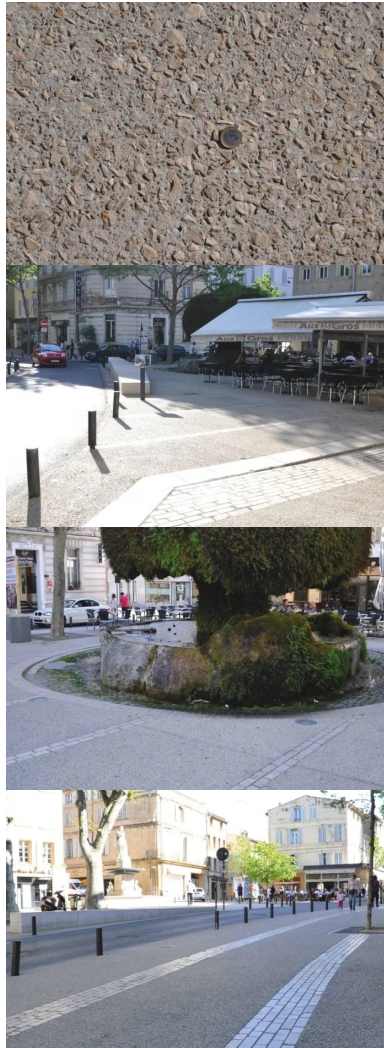
Les cailloux utilisés dans les bétons décoratifs proviennent de la carrière de Châteauneuf-les-Martigues (Bouches-du-Rhône), située à 50 km.

Le marché (dit « de définition ») lancé à l'origine a très vite montré « qu'il fallait envisager le problème de façon beaucoup plus large pour rester cohérent et englober dans cette réflexion les cours du centre-ville, vitaux pour l'activité économique, car ils accueillent de nombreux commerces », expliquaient à l'époque les responsables des services techniques (cf. Routes n° 98, décembre 2006, pp. 18-19). Problème important : l'absence de réseau d'eaux pluviales posant de « sérieux soucis en matière d'hygiène publique ». À la moindre intempérie, tout se déversait dans le canal de Craonne, un ouvrage datant de la Renaissance et destiné à irriguer la plaine environnante de la Crau. En prime, il existait encore d'anciennes canalisations en plomb, posant des problèmes en matière d'assainissement et d'eau potable.