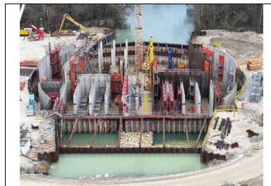
L'enceinte du bâtiment a été délimitée par des rideaux de palplanches avant que soit coulé le bouchon en béton du batardeau principal.

Ces cinq ouvrages régulateurs, tous gérés par l'établissement public territorial de bassin Seine Grands Lacs, ont pour objectif d'écrêter les crues exceptionnelles en réduisant de 70 cm à 1 m de hauteur la présence de l'eau dans Paris et de prévenir d'autant des dommages et impacts économiques. L'opération de travaux du Site pilote de la Bassée a également eu pour objectif de valoriser écologiquement la zone humide de la Bassée aval en réalisant de nombreux travaux de génie écologique sur cinq secteurs identifiés comme remarquables dans le but de reconquérir la biodiversité.