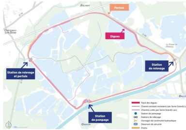
Plan de l'ensemble du site de la Bassée.

Une crue centennale de la Seine, la dernière remonte à 1910, inonderait la région parisienne et immobiliserait des millions de personnes. C'est pour éviter ce scénario catastrophe qu'un nouvel aménagement sur le bassin amont de la Seine a été réalisé en lisière de l'Yonne et de la Seine-et-Marne dans la vallée de la Bassée, la plus grande plaine inondable du bassin de ce secteur et la plus importante zone humide d'Île-de-France. Le principe est simple : lorsque les débits de l'Yonne, de la Seine ou du Loing engendrent un risque de crue majeure pour la région parisienne, l'eau est pompée et retenue dans un espace délimité par des digues, aussi appelé casier hydraulique.