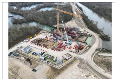
L'emprise a été vidangée afin de réaliser le radier puis les superstructures.