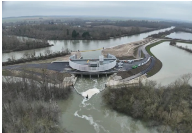
Essai de mise en eau en janvier 2025. Vue côté évacuation.

Par la suite, les travaux ont été suivis par une maîtrise d'œuvre d'exécution. Le génie civil a été réalisé par les équipes de Spie Batignolles entre 2022 et 2024. Construit sur pilotis (poteaux en béton), l'équipement compte trois niveaux : à hauteur d'eau s'étend le sou-bassement en béton matricé où se déroule le processus hydraulique – pompes, bâches de dissipation en sortie des pompes... Au niveau supérieur s'organisent les espaces de travail – salle de commande, base vie et de repos, salle de réunion accessible au public, locaux électriques et d'entretien ; accessible aux visiteurs et conçu comme un jardin suspendu regroupant les variétés endémiques, le toit-terrasse offre un point de vue à 360 degrés sur le territoire.