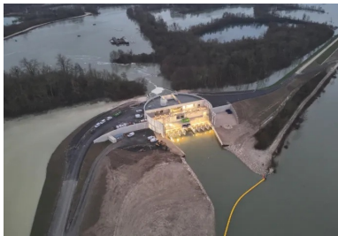
Essai de mise en eau en janvier 2025. Vue côté pompes.