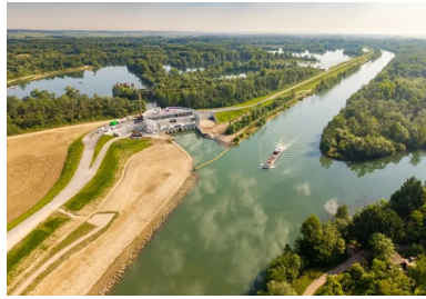
Dans le chenal qui relie une darse à la Seine est insérée la station de pompage.

Une crue centennale de la Seine, la dernière remonte à 1910, inonderait la région parisienne et immobiliserait des millions de personnes. C'est pour éviter ce scénario catastrophe qu'un nouvel aménagement sur le bassin amont de la Seine a été réalisé en lisière de l'Yonne et de la Seine-et-Marne dans la vallée de la Bassée, la plus grande plaine inondable du bassin de ce secteur et la plus importante zone humide d'Île-de-France. Le principe est simple : lorsque les débits de l'Yonne, de la Seine ou du Loing engendrent un risque de crue majeure pour la région parisienne, l'eau est pompée et retenue dans un espace délimité par des digues, aussi appelé casier hydraulique.