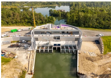
La partie supérieure de la station offre un point de vue à 360 degrés sur tout le paysage environnant.

« Nous avons commencé par ceinturer l'enceinte de 52 m avec des rideaux de palplanches stabilisées par des tirants d'ancrage. Puis nous avons coulé 2 400 m 3 de béton immergé de classe d'exposition XF1/XC3/XC4/XD1 (F) – un béton qui se consolide très vite – pour former le bouchon du batardeau principal. L'ancrage de cet ouvrage est renforcé par 339 pieux en béton injecté répartis à l'intérieur de l'enceinte. Après une vidange, nous avons réalisé le radier – 250 m 3 de béton – et les superstructures en béton de classe d'exposition XD3 (F) avec ses huit pertuis de pompage. Séparés des pompes, deux pertuis de vidange gravitaire complètent l'équipement. Au total ce sont 4 000 m 3 de béton qui ont été nécessaires pour réaliser cet ouvrage », explique encore Pascal Laugier.