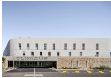
Le soubassement en moellons et les portiques en béton gris renforcent la légèreté visuelle des niveaux supérieurs en béton blanc.

rappelant au passage la prégnance du minéral dans l'architecture méridionale. Ces valeurs se retrouvent dans la mise au point pointilleuse du béton. Le choix de granulats clairs issus de carrières locales répond au souci de minimiser l'impact logistique. Une attention particulière a permis de maîtriser la formulation et la teinte , en faveur d'une homogénéité des parements, avec l'élaboration d'une formulation de béton architectonique à faible empreinte carbone. Des prototypes ont parallèlement permis de valider les solutions de liaison entre béton frais et béton durci proposées par l'entreprise. Celle-ci a été associée à l'étude du calepinage des voiles : rythme des trous de banches, positionnement des reprises de coulage au droit des ouvertures et optimisation des hauteurs pour limiter les reprises verticales.