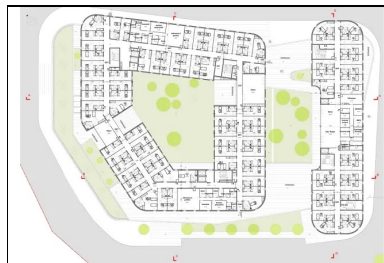
Plan du r+1 de la clinique et de l'Ehpad.