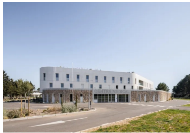
La disposition décalée des fenêtres et le retrait des niveaux supérieurs contribuent à la douceur des volumes.

Généralant un véritable microclimat, les patios agissent comme autant de puits de lumière. Ils assurent un apport bienfaisant en éclairage naturel tout en évitant les surchauffes estivales. Compte tenu de la profondeur importante du bâtiment, la conception s'est naturellement structurée autour de deux grands patios, complétés par d'autres plus modestes, en faveur d'une organisation fluide et flexible des espaces. Ils définissent des zones tampons abritées, propices aux échanges d'air, notamment au rafraîchissement passif des locaux.