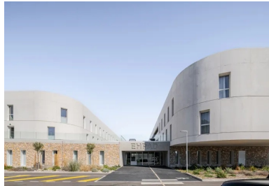
L'entrée de l'Ehpad est marquée par un profond porte-à-faux et les angles arrondis des niveaux supérieurs, qui renvoient à la dimension du « care ».

Contrepoint au béton, le soubassement est constitué de moellons en pierre calcaire de 20 cm d'épaisseur, récupérés sur site et montés au mortier . Fidèle à l'appareillage rustique, il rappelle les restanques, ces constructions en pierres sèches typiques du Bassin méditerranéen.