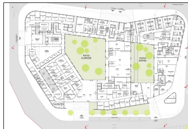
Plan du rez-de-chaussée de la clinique et de l'Ehpad.