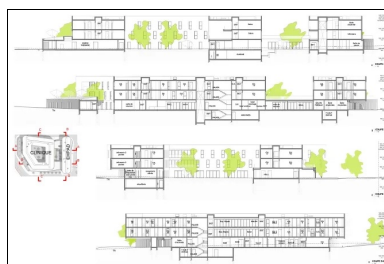
Coupes longitudinales et transversales.