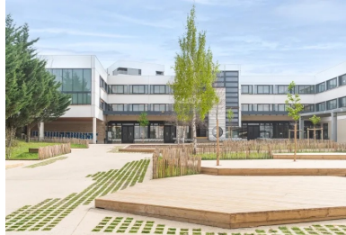
Cour du collège à Noisy-le-Grand.