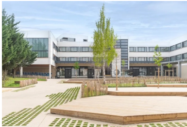
Cour du collège à Noisy-le-Grand.