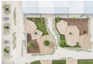
Cour du collège en vue aérienne à Noisy-le-Grand.

Le projet de Noisy-le-Grand consiste en la rénovation d'une cour largement dominée par des enrobés noirs qui accumulaient la chaleur et rendaient l'espace peu confortable durant les mois d'été. « Nous avons opté pour un revêtement uniforme et monolithique en béton désactivé intégrant des alvéoles végétalisées », explique Mathieu Morel. Ce choix permet de maintenir un cheminement accessible aux personnes à mobilité réduite (PMR), tout en favorisant la biodiversité. Les allées principales, totalement minérales, se végétalisent progressivement aux abords des espaces plantés, créant ainsi un environnement harmonieux.