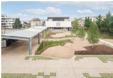
Cour du collège à Noisy-le-Grand.

Retrouvez ci-dessous le dossier Le béton, matériau-clé pour aménager de manière responsable