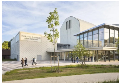
Les volumes fonctionnels s'identifient clairement dès le parvis d'accueil public et arboré.

Aux portes de la ville, solidement ancré dans son territoire, le théâtre de Beauvais s'impose telle une nef profane, entre audace architecturale et mémoire patrimoniale.