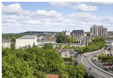
Depuis le plateau sud, le théâtre s'affiche comme le troisième monument de grande hauteur dans la ville.

L'architecte François Chochon explique avec humour : « Nous avons tourné comme un chien qui cherche sa place dans sa niche. » Trouver cette juste implantation fut ainsi la première étape, pour qu'à chaque échelle – du pas du voisin jusqu'au regard lointain – le théâtre s'invite avec délicatesse.