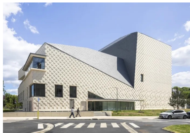
Abaissé au maximum, le volume contenant l'auditorium semble s'enclaver dans celui contenant la cage de scène.

Préfecture de l'Oise, labellisée Ville d'art et d'histoire, Beauvais conserve les empreintes d'un passé foisonnant. Au XII e siècle, son rayonnement s'appuie sur le commerce et la draperie, avant que Colbert n'y fonde au XVII e siècle la manufacture de tapisserie qui scellera durablement sa réputation. Centre d'un évêché puissant, la ville se dote aussi d'une cathédrale gothique vertigineuse, ambitieuse jusqu'à vouloir surpasser toutes les autres : sa nef fut inachevée mais son chœur, haut de 48 m, demeure un chef-d'œuvre saisissant. Beauvais porte aussi la mémoire des drames : en juin 1940, les bombardements détruisent plus de la moitié de la ville, épargnant miraculeusement ses édifices religieux. La reconstruction s'attache alors à conjuguer modernité et héritage. Limitation des hauteurs, toitures imposées, pierres de l'Oise, briques et tuiles émaillées issues de l'industrie locale : tout est pensé pour redonner à la ville un visage en harmonie avec son histoire.