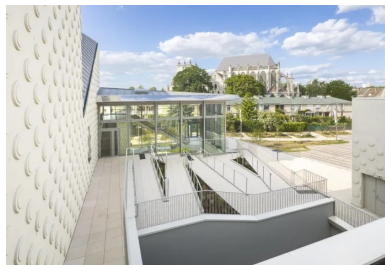
Une rampe d'ambulation permet de rejoindre une vaste terrasse, lieu de rassemblement durant les entractes.

Premier geste fondateur : désaxer le bâtiment par rapport aux limites parcellaires, à rebours de son prédécesseur. Cette inclinaison libère l'équipement de toute frontalité, l'ouvre sur l'artère d'entrée de la ville et déploie de généreux parvis de part et d'autre. Les maisons bourgeoises, longtemps étouffées, retrouvent ainsi des perspectives dégagées, tandis que l'aire de déchargement, elle aussi, respire grâce à un accès facilité.