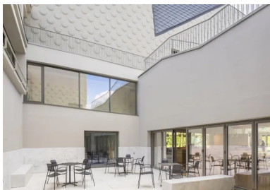
Un patio accessible ménage un lien visuel entre la salle d'animation, avec le bar, et les loges privées.

Au final, ce cadre propice aux rencontres s'impose comme une « maison commune » et paracheve avec brio une vision urbaine. « Au départ, le lieu théâtral doit être un vide inspirant, inspirant pour les acteurs, pour les metteurs en scène et aussi pour les spectateurs. Il faut que le public y devienne talentueux », rappelait la metteuse en scène Ariane Mnouchkine. Le théâtre de Beauvais incarne pleinement cette promesse.