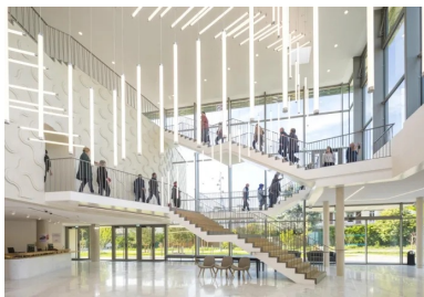
Sous la triple hauteur du hall, l'escalier monumental est à l'image de la fonction théâtrale.