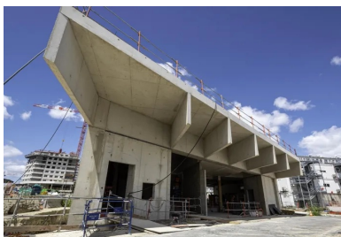
Gare de Bagneux-Lucie-Aubrac, Atelier Barani, architectes

Pas moins de 68 gares, dont 80 % reliées à l'actuel réseau, desserviront quartiers d'affaires, pôles scientifiques, aéroports et gares TGV. Selon les projections, trois millions de personnes seront transportées, avec l'objectif de limiter la part de la voiture au profit des transports collectifs tout en améliorant la desserte régionale. Ce vaste chantier s'accompagne de 180 projets d'aménagement urbain et paysager autour des gares.