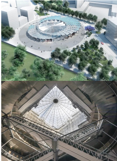
Gare de Villejuif-Institut-Gustave-Roussy, Dominique Perrault Architecture, image : © DPA, photo : © Cyrus Cornut.

Le recyclage de 80 % des déblais de chantier et leur évacuation sous terre pour limiter les rotations de poids lourds traduisent la priorité environnementale.