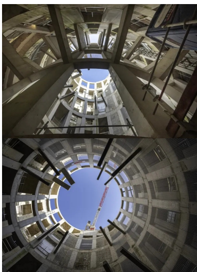
Gare de Saint-Maur-Créteil, ANMA Architectes Urbanistes

Une charte d'architecture basée sur les dimensions haptique et corporelle, la variété d'espaces et d'éclairages oriente la conception des gares. Une grande diversité d'ambiances, d'acoustiques et de matériaux accompagnent les bétons, incontournables pour ces infrastructures souterraines. Tandis que la gare d'Antony-Wissous (Ateliers 2/3/4/ architectes) prend la forme d'un bâtiment biomorphe en béton de granulats clairs, celle de Bagneux-Lucie-Aubrac (atelier Barani, architectes) se rapproche d'une grotte souterraine avec son béton texturé clair. Cette ambition esthétique se traduit aussi par l'association, dans chaque gare, entre un architecte et un artiste en vue de créer des univers identifiants par les voyageurs.