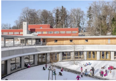
La cour des maternelles occupe tout l'espace central du cercle.