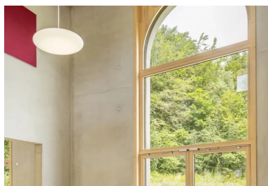
Le béton brut des murs et du plafond, associé à des éléments en bois et à la lumière naturelle qui pénètre par la grande fenêtre, l'imposte vitrée placée dans la double hauteur et la circulation qualifient le volume des salles.