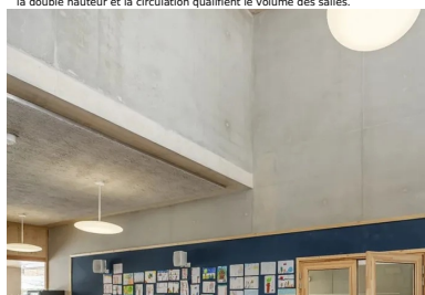
Le béton brut des murs et du plafond, associé à des éléments en bois et à la lumière naturelle qui pénètre par la grande fenêtre, l'imposte vitrée placée dans la double hauteur et la circulation qualifient le volume des salles.