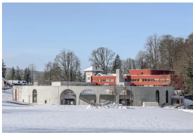
À travers les grandes arches cintrées qui marquent l'entrée se devine l'intérieur de l'école. Au second plan, le bâtiment réhabilité repeint en rouge.

Lové dans une dépression du terrain, le cercle scolaire La Franche-Montagne s'inscrit profondément dans le sol, au sens physique du terme. Il marque une entrée de la ville, par son architecture singulière – un bâtiment circulaire, en anneau, contenu dans de hauts voiles de béton –, ajoutant une dimension ludique à l'expression de son statut d'équipement public à vocation pédagogique et protectrice. Il remplace l'ancienne école du centre-ville de cette petite commune de moyenne montagne du massif du Jura située à une dizaine de kilomètres de la frontière franco-suisse, dont la capacité d'accueil est devenue insuffisante, difficile à étendre et à mettre aux normes.