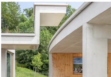
À l'étage, le passage protégé vers l'école élémentaire avec sa casquette anguleuse qui laisse filer la courbe de la toiture.

Précédé d'une « langue » de parking paysager associé à deux noues pour infiltrer les eaux de pluie à la parcelle et bordé par un champ, le bâtiment se déploie à partir d'une doline, une excavation circulaire généralement fermée, à fond plus ou moins plat. De plan circulaire, l'extension y est calée de manière à préserver la vue du bâtiment existant situé en partie haute du terrain, créant un étage depuis l'entrée, avec la cour haute et la toiture plantée qui atténue l'effet de hauteur de ses murs courbes de 8 m.