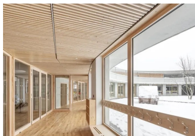
Circulation vitrée qui borde d'un côté la cour des maternelles, de l'autre les salles qu'elle distribue.

Réhabilité et réaménagé pour accueillir les classes d'élémentaire, le bâtiment existant construit dans les années 1970 fonctionne avec le nouveau bâtiment où se trouvent, en plus des salles de classe de maternelle, toutes les salles communes au groupe scolaire comme le réfectoire, la bibliothèque et la salle polyvalente ainsi que l'accueil périscolaire. Visibles depuis le parvis de l'entrée commune traitée en porche avec ses arcades hautes, la cour des maternelles occupe le centre du cercle à rez-de-chaussée et, au-dessus, la cour haute en anneau et en balcon est celle des élèves d'élémentaire. Sans être mélangés, les élèves gardent un contact visuel et, sans doute, sonore. La cour haute, aménagée sur la toiture intermédiaire, est en partie protégée du soleil et de la pluie sur sa périphérie par le débord de la toiture en béton . Le bois du sol et des murs confère une intériorité à cet espace à ciel ouvert atypique où les enfants s'ébattent ou se posent et parfois, usage imprévu, l'utilisent en vélodrome.