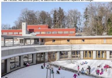
La cour des maternelles occupe tout l'espace central du cercle.