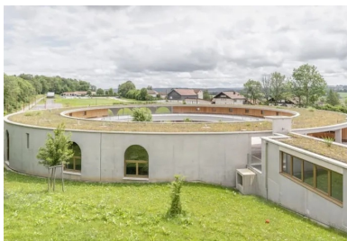
Encastrée dans le talus, l'extension ceinte par des murs de béton brut, sobres. La toiture végétalisée contribue à son insertion paysagère.

Avec son enceinte de béton brut, le cercle scolaire La Franche-Montagne conçu par les architectes de BQ+A se coule dans la topographie du site.