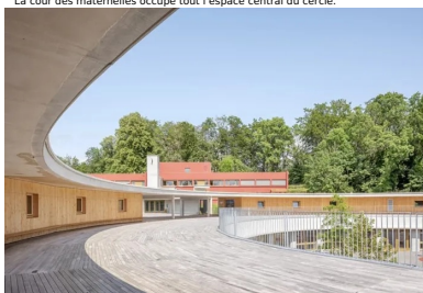
La cour des élémentaires, aménagée sur la toiture intermédiaire.