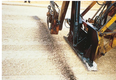
Réalisation de la préfissuration à l'aide de la machine Craft Emulsion®.