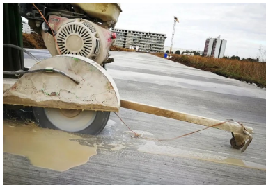
Sciage de joint sur chaussée en BCR.