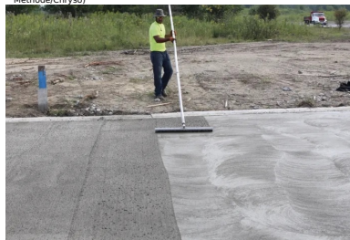
Le BCR reçoit ensuite le traitement de surface prévu : ici, une finition balayée traditionnelle. (©Moderne Méthode/Chryso)