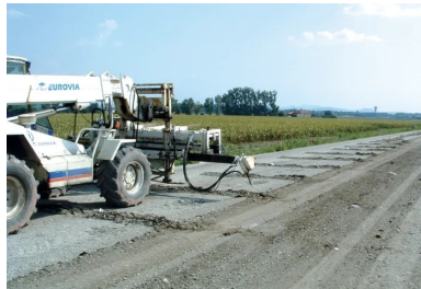
Réalisation de la préfissuration à l'aide de la machine Olivia®.

NOTA : le cas échéant, une couche granulaire de 8 cm d'épaisseur peut jouer le rôle d'une couche anti-remontée de fissures, mais à condition d'accepter son rôle de couche de séparation.