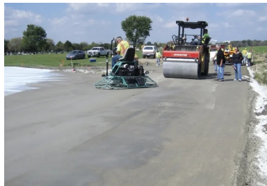
L'adjuvant spécial au BCR s'applique sur la surface juste avant le passage de la truelle mécanique, avec un pulvérisateur à grand débit. Il permet au béton d'être taloché fin, avec suffisamment de pâte cimentaire en surface.