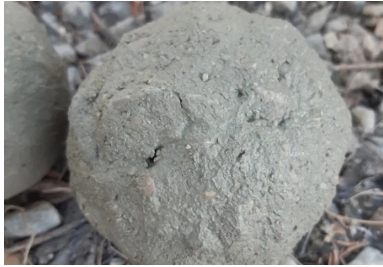
La consistance optimale du BCR, succès de « l'essai à la boule » pour un BCR poreux et pour un BCR de surface.