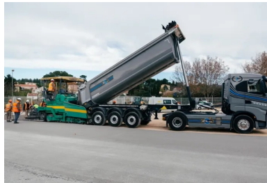
Un camion-benne, bâché durant le transport du BCR, déverse le matériau dans le finisseur. Celui-ci répand, nivelle et compacte le BCR.