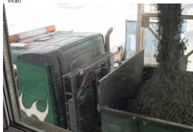
Le BCR peut être fabriqué dans une centrale continue de type grave traitée.