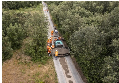
Réfection d'une piste cyclable : mise en œuvre au finisseur d'un BCR bas carbone intégrant 100 % de granulats recyclés.

En surface ou sous l'enrobé, le béton compacté routier (BCR) fait l'objet d'une évolution continue et se développe dans plusieurs domaines des infrastructures de mobilité. En effet, combinant l'avantage d'une mise en œuvre rapide et mécanisée (matériels routiers) et d'une formulation optimisée en liant, le BCR offre aujourd'hui une solution performante et durable répondant aux attentes environnementales et économiques. Le développement des BCR à l'international est très significatif ces dernières années. Un peu plus de trente ans après une première publication par Cimbéton, ce numéro de Routes Info fait le point.