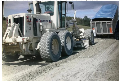
Un camion-benne, bâché durant le transport du BCR, déverse le matériau devant la niveleuse. Celle-ci répand et nivelle le BCR.