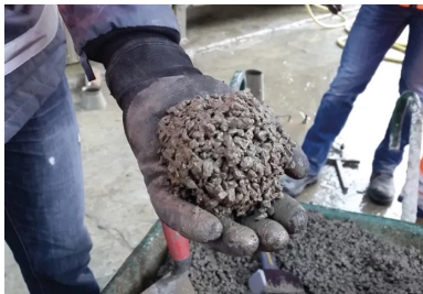
La consistance optimale du BCR, succès de « l'essai à la boule » pour un BCR poreux et pour un BCR de surface.