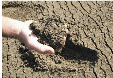
Le matériau BCR est constitué de granulats, de liant hydraulique (ciment ou LHR), d'eau et éventuellement d'adjuvants.

Les adjuvants plastifiants/réducteurs d'eau peuvent également être utilisés pour :