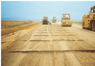
Atelier de compactage du BCR, constitué de rouleaux vibrants suivis d'un compacteur à pneus.