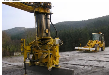
Réalisation de la préfissuration avec le procédé Joints Actifs®.

Les règles à appliquer et les précautions à prendre pour limiter la fissuration des BCR sont contenues dans :