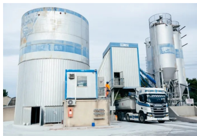
Centrale discontinue de type BPE, où le BCR est étudié et fabriqué.