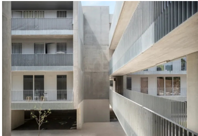
Le béton révèle ses différentes facettes : dynamisme visuel, jeux d'ombres et grandes portées.