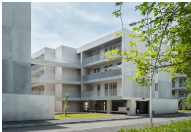
La présence des coursives et des loggias exprime la priorité accordée à la relation étroite entre intérieur et extérieur.