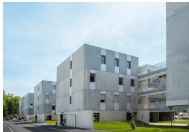
Le jeu entre pleins et vides, entre avancées et retraits, assouplit l'organisation rigoureuse des volumes. Intercalées entre les plots, les coursives offrent un parcours suspendu.