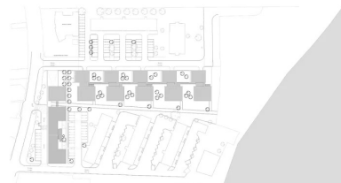
Le plan masse traduit la perméabilité urbaine et l'articulation des volumétries de l'opération.

Dans leur plan masse, les architectes ont recherché l'insertion paysagère et l'ouverture du quartier sur la ville. Avec son rez-de-chaussée dédié aux activités et commerces, le corps de bâtiment linéaire sur l'avenue Maryse-Bastie est complété par une série de plots dans un souci de perméabilité urbaine. S'agissant d'une zone inondable, les parkings occupent le rez-de-chaussée mais sont dissimulés derrière un discret talus engazonné. Le gabarit R+3 assure une transition entre les pavillons voisins et les bâtiments conservés R+5. Contrastant avec la rigueur géométrique des barres des années 1960, un système de coursives relie avec une légèreté visuelle les volumes bâtis donnant sur un vaste jardin collectif.