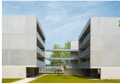
Dominant des gazons aux découpes géométriques, l'architecture oscille entre composition orthogonale et nuances des surfaces en béton.