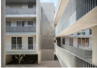
Le béton révèle ses différentes facettes : dynamisme visuel, jeux d'ombres et grandes portées.