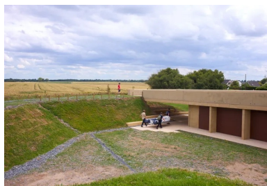
L'accès à la toiture-terrasse s'effectue directement depuis le talus à l'angle sud-est.

La toiture-terrasse constituée d'une dalle épaisse en béton , accessible dans le prolongement du talus sur l'extrémité est, accuse volontairement une légère pente, s'élevant progressivement d'un mètre : une manière de donner la direction vers la première casemate et, en retour, d'inscrire le pavillon dans le parcours de ce chapelet d'abris militaires qui ponctuent encore le littoral. « Seul l'horizon est horizontal dans le site » justifie Adrien de Bellaigue, l'un des associés de l'agence d'architecture dbo conceptrice du projet, ajoutant « la toiture donne une direction et permet d'être plus tapis dans sol à l'est qu'à l'ouest où elle émerge du terrain. » Depuis ce belvédère, le paysage qui s'offre rassemble l'horizon, le littoral, le plateau agricole et l'arrière pays. Par temps clair, on perçoit côté terre au-delà de Bayeux et, côté mer, la pointe de Barfleur et la baie de Seine, faisant comprendre l'implantation stratégique de la batterie de Longues-sur-Mer.