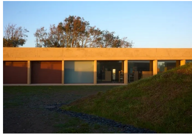
La façade nord est rythmée par les poteaux-lames en béton dont la finesse de la tranche contraste avec l'épaisseur de la dalle qu'ils soutiennent.

La dalle est supportée de part et d'autre par des poteaux-lames et des voiles extérieurs, les parois vitrées et pleines des locaux qu'elle abrite étant placées en retrait. Ce dispositif permet de faire varier les vues et la pénétration de la lumière naturelle mais aussi la perception du bâtiment — plateforme flottante entre deux talus ou toiture pesante et protectrice.