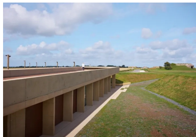
Le belvédère s'élanç vers l'ouest, indiquant le chemin vers la première casemate.

Situé à l'arrière de la batterie, le nouvel édifice remplace l'ancien pavillon d'accueil, jugé inadapté. Par souci de discrétion vis-à-vis des vestiges historiques alentours et d'insertion paysagère, il est construit dans une tranchée jouant à la fois de la topographie et du modelage du sol. L'accès piétons depuis la zone de stationnement aménagée au sud, même jusqu'à l'entrée ouest du bâtiment niché au bout de cette tranchée. Tout en longueur, le pavillon s'étire d'ouest en est sur 54 mètres et 8,70 mètres de largeur par 4 à 5 mètres de hauteur. Il se termine à chaque extrémité par un porte-à-faux de 7,20 mètres, qui forment ainsi deux auvents protecteurs de la pluie, du vent et du soleil, suivant la saison. Entre les deux, se trouvent l'office du tourisme et divers locaux fermés, techniques et de stockage.