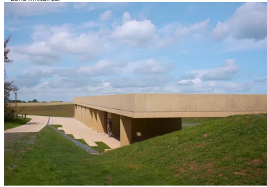
Le béton teinté dans la masse s'accorde aux couleurs et aux matières du paysage environnant.