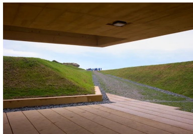
Les porte-à-faux offrent des préaux à l'abri des intempéries.

Le pavillon a été distingué par le prix 10+1 organisé par la revue d'architecture d'A.