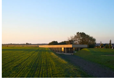
Le nouveau pavillon s'installe avec légèreté dans l'épaisseur du site.

Plateforme en béton intégrée à la topographie du site, le nouveau pavillon d'accueil de la batterie de Longues-sur-mer conjugue paysage et architecture au service de l'histoire.