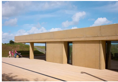
Les voiles de structure en béton de la façade sud rappellent la compacité des abris militaires.

Située entre les plages d'Omaha-Beach et de Gold-Beach, en pleine zone du débarquement des forces alliées le 6 juin 1944 en Normandie, Longues-sur-Mer conserve en bon état de cette période sa batterie de tir de canon construite en béton armé par les Allemands : quatre casemates qui abritaient les canons de marine longue portée et, à l'avant, le poste de direction de tir. Prise par les troupes britanniques dès le lendemain du débarquement, elle fit l'objet d'un classement au titre des Monuments historiques en 2001. Lieu de mémoire du « mur de l'Atlantique » donc, cette petite commune rurale du Calvados de moins de 600 habitants voit passer jusqu'à 400 000 visiteurs par an. L'affluence qui ne se dément pas, voire augmente, justifiait la construction d'un pavillon à même d'accueillir et d'orienter tout au long de l'année l'afflué conséquent de personnes. Le projet se devait d'améliorer les conditions d'accueil à la batterie mais aussi d'intégrer l'office du tourisme.