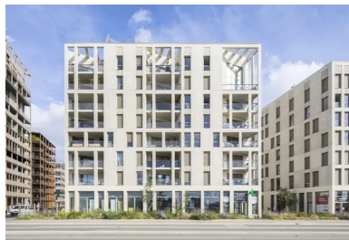
Chaque façade exprime un mode d'habiter, ici les loggias prolongent le séjour.

Le bâtiment en R+13 a été réalisé par l'agence Leibar Seigneurin Architectes alors que les deux plots en R+6 et R+7 sont l'œuvre de l'agence Philippon-Kalt. Cette dernière a réussi à proposer deux constructions dont les façades relèvent le défi de leur perception lointaine tout en prenant en compte les multiples contraintes inhérentes au site et à leurs commanditaires.