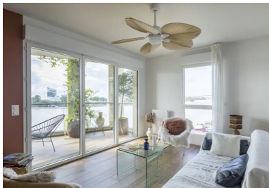
Les loggias attenantes au séjour peuvent être transformées en jardin d'hiver.

Pour limiter les charges des habitants, les cages d'escalier sont éclairées naturellement. Le terrain étant classé en zone inondable dans le Plan de prévention des risques naturels d'inondation (PPRI), le rez-de-chaussée ne comprend aucun logement. Le niveau des locaux d'activité qui s'y trouvent respecte la cote de seuil, alors que le local à vélos est transparent aux crues grâce à sa façade partiellement ajourée qui laisse l'eau s'écouler librement.