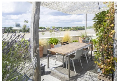
Les surfaces des toitures sont aménagées en terrasses privées.

Au final, le béton a été légèrement teinté dans la masse. Par sa tonalité grège chaude, ni trop jaune ni trop claire afin de ne pas risquer d'éblouir, et sa minéralité, il fait écho à la pierre blonde des façades XVIII e siècle des quais de la rive gauche. Les architectes souhaitaient que l'ensemble des ouvrages en béton soient coulés en place, de manière à obtenir un matériau brut et vivant, marqué par les irrégularités de surface et variations inhérentes à ce mode de production artisanal.