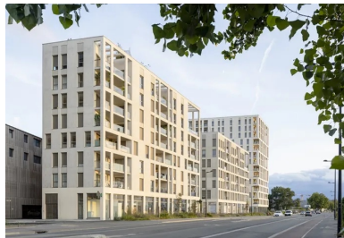
Les trois bâtiments de la résidence créent une séquence urbaine homogène.

Depuis quelques décennies, le vent tourne. La Bastide, le quartier le plus ancien de la rive droite, proche du pont de Pierre, a été le premier à connaître une profonde transformation. La création du pont Chaban-Delmas, inauguré en 2013, a permis de désenclaver plus largement la rive et ouvert le champ des possibles. L'aménagement du quartier Brazza poursuit cette reconquête de la rive droite. Il vise à recycler une ancienne friche industrielle et à créer sur 24,5 ha un lieu de vie paysager comprenant 40 % d'espaces en pleine terre. Depuis peu, les premières constructions sont sorties de terre et matérialisent ce que sera ce quartier dans quelques années, alternant zones compactes et surfaces végétalisées.