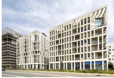
Avec une matrice identique, la variation des pleins et des vides offre une identité propre à chaque plot.

Avec ses résilles de béton clair visibles de très loin, elle crée un front urbain dont les teintes entrent en résonance avec la ville ancienne.