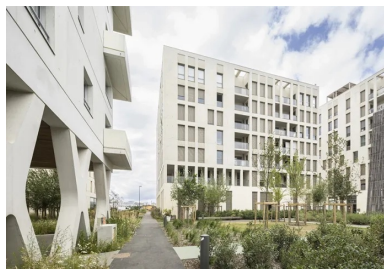
La compacité des constructions dégage de la surface en cœur d'îlot convertie en jardin.