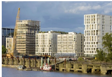
Les constructions situées en bord de Garonne forment un front compact visible de loin.

Les deux bâtiments de logements conçus par l'agence Philippon-Kalt en font partie. La position en bord de Garonne leur insufflé un rôle particulier. Ils participent d'une séquence en front de fleuve qui peut être perçue de loin et signale la présence du quartier notamment depuis l'autre rive. Faisant fonction de vitrine, l'opération s'est conformée à un certain nombre de directives déterminées par l'urbaniste en charge, l'agence YTAA, la Métropole et le maître d'ouvrage. Afin d'intégrer les enjeux de ce contexte particulier, les immeubles devaient créer une séquence cohérente avec les autres éléments bâtis, tout en permettant une identification claire de chacune des trois constructions. Organisés en plot, ils ont une hauteur différente et leur conception a été répartie en deux lots.