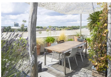
Les surfaces des toitures sont aménagées en terrasses privatives.

Au final, le béton a été légèrement teinté dans la masse. Par sa tonalité grège chaude, ni trop jaune ni trop claire afin de ne pas risquer d'éblouir, et sa minéralité, il fait écho à la pierre blonde des façades XVIII e siècle des quais de la rive gauche. Les architectes souhaitaient que l'ensemble des ouvrages en béton soient coulés en place, de manière à obtenir un matériau brut et vivant, marqué par les irrégularités de surface et variations inhérentes à ce mode de production artisanal.