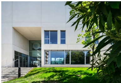
Le hall traversant s'ouvre également au nord et permet de rejoindre directement le centre de formation depuis l'accès principal du site.