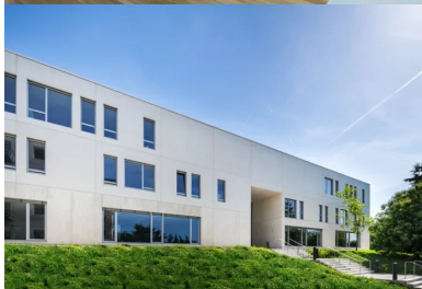
Vue de la façade nord.