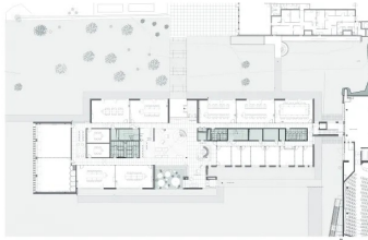
Plan de rez-de-chaussée 1. Entrée 2. Accueil 3. Hall 4. Salles de formations 5. Bureaux des formateurs

Ils sont longés de part et d'autre par un couloir de desserte. Au rez-de-chaussée, sont regroupés les bureaux des formateurs, des espaces de co-working et toutes les salles de formation. Ces dernières se répartissent le long des façades nord, ouest et sud. Le premier et le deuxième étage sont réservés aux bureaux de l'entreprise. De différentes tailles, certains de grande dimension sont traités en open space. Sur ces deux étages, les bureaux sont entièrement modulables en fonction des besoins de l'entreprise et de leurs évolutions. Dans tout le bâtiment, les couloirs sont séparés des salles de formation et des bureaux par des cloisons vitrées sérigraphiées. Les utilisateurs sont ainsi protégés des regards et les circulations bénéficient de la présence de la lumière naturelle qui agrmente les parcours.