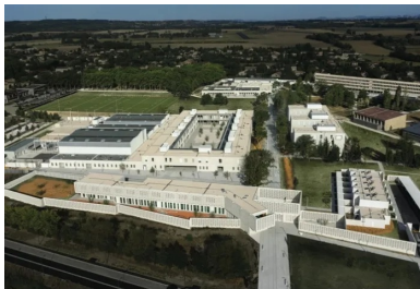
Les bâtiments du lycée sont distribués par un grand axe nord-sud traité en « quasi-promenade » qui constitue l'épine dorsale du projet.