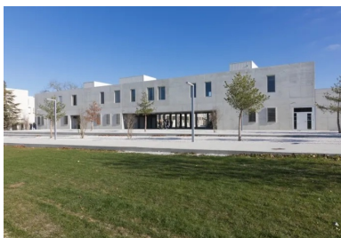
Le bâtiment enseignement vu de puis le « campo central ».

Chaque lieu bénéficie ainsi d'un bon éclairage naturel et d'une vue de qualité participant à un meilleur confort et à des économies d'énergie. Comme un corollaire à la présence paysagère, le parcours est un élément important de ce lycée presque « à ciel ouvert », comme une référence historique au lycée d'Athènes où Aristote enseignait en se promenant avec ses élèves.