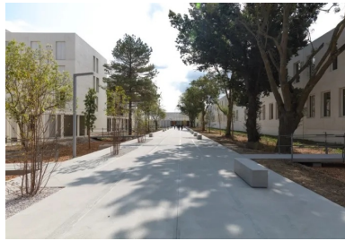
Les arbres remarquables du site ont été conservés, ils accompagnent le « quai-promenade ».

Ce faisant, les architectes ont proposé de supprimer l'ensemble des clôtures qui séparaient auparavant les enceintes des différents lycées pour ne créer qu'une seule grande entité éducative où lycéens du monde agricole, professionnel et général partagent un cœur végétal.