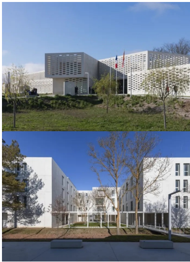
Les éléments préfabriqués des claustras sont réalisés en béton autoplaçant et autonettoyant.