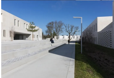
Le nouveau lycée se présente comme une petite cité composée de différentes unités fonctionnelles.