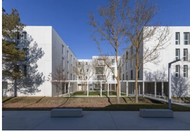
L'internat s'oriente autour de plusieurs cours plantées qui confèrent de l'intimité aux chambres.