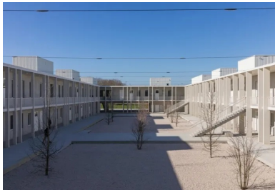
Le bâtiment des classes d'enseignement s'organise autour d'une vaste cour centrale.

Restant attentifs à l'effet de masse qu'un matériau unique peut produire à l'échelle d'un équipement aussi important, le béton a été décliné dans différents aspects de surface. Les façades des bâtiments sont traitées soit avec un parement à la planche soit avec une finition lisse. Il en résulte une combinaison graphique d'une grande richesse, mixant jusqu'à quatre aspects de surfaces différents qui composent l'écriture architecturale du lycée. A ces qualités s'ajoutent la pérennité, l'économie ainsi que l'inertie thermique qui participe à la RT 2012 et au confort d'été par une surventilation nocturne qui charge en frigories les murs de refend, les sols et les plafonds. « Le béton, un matériau simple, robuste et économique au service d'une expression plastique très élaborée », concluent les architectes.