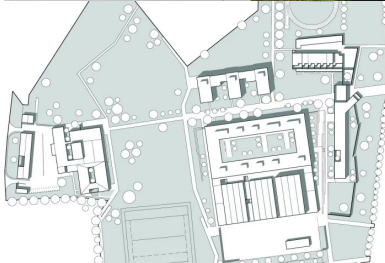
Plan général 1. bâtiment d'accueil 2. Enseignement 3. Ateliers enseignement technique 4. internat 5. Restauration 6. logements de fonction