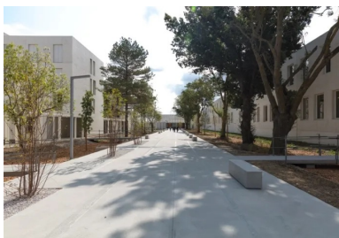
Les arbres remarquables du site ont été conservés, ils accompagnent le « quai-promenade ».

Ce faisant, les architectes ont proposé de supprimer l'ensemble des clôtures qui séparaient auparavant les enceintes des différents lycées pour ne créer qu'une seule grande entité éducative où lycéens du monde agricole, professionnel et général partagent un cœur végétal.