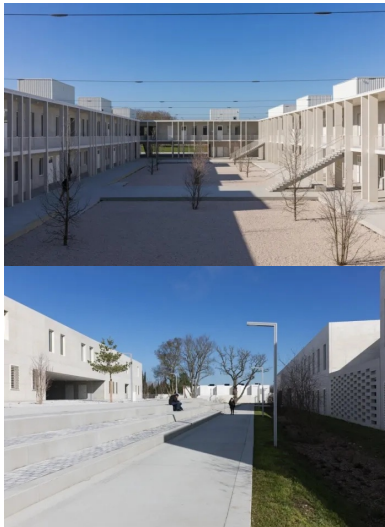
Le bâtiment des classes d'enseignement s'organise autour d'une vaste cour centrale.

Restant attentifs à l'effet de masse qu'un matériau unique peut produire à l'échelle d'un équipement aussi important, le béton a été décliné dans différents aspects de surface. Les façades des bâtiments sont traitées soit avec un parement à la planche soit avec une finition lisse. Il en résulte une combinaison graphique d'une grande richesse, mixant jusqu'à quatre aspects de surfaces différents qui composent l'écriture architecturale du lycée. À ces qualités s'ajoutent la pérennité, l'économie ainsi que l'inertie thermique qui participe à la RT 2012 et au confort d'été par une surventilation nocturne qui charge en frigories les murs de refend, les sols et les plafonds. « Le béton, un matériau simple, robuste et économique au service d'une expression plastique très élaborée », concluent les architectes.