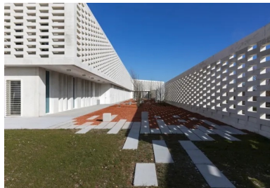
Les éléments préfabriqués des claustres sont réalisés en béton autoplaçant et autonettoyant.