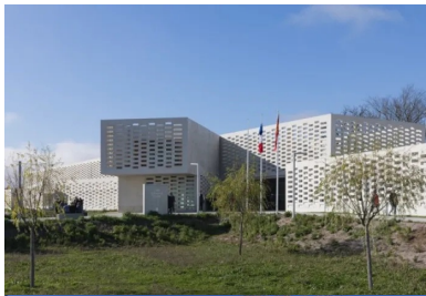
Les éléments préfabriqués des claustras sont réalisés en béton autoplaçant et autonettoyant.