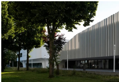
Gymnase et MSP – Implantés en alignement, les deux équipements sont bordés par un parvis public piétonnier qui permet de traverser la parcelle de rue à rue.

Si l'ossature de l'équipement, selon un système de murs porteurs en béton , relève d'un dispositif constructif classique, il n'en fut pas de même pour la réalisation des ferrillages et des coffrages. « Le chantier de gros œuvre a été réalisé par une petite entreprise locale et ce fut assez expérimental », raconte encore Christophe Gulizzi. En effet, les formes courbes ont nécessité la mise au point et la fabrication d'immenses moules en polystyrène, lesquels furent placés dans les banches. Ces éléments avaient été recouverts d'une fine couche de résine afin d'éviter que des bulles de plastique ne marquent le béton. Coulé en deux fois, le matériau brut est recouvert d'une peinture minérale de couleur blanche posée après ragréage .