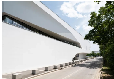
Gymnase - En partie haute du gymnase, une profonde découpe abrite une terrasse qui est accessible depuis le haut des gradins.

Développant une puissante musculature de béton, le gymnase se présente comme un monolithe sculptural et massif. L'effet d'épaisseur est d'autant plus perceptible que chacune de ses façades est évidée par des découpes galbées qui sont comme taillées à la serpe. Complexes, ces entailles ne sont en rien un formalisme gratuit mais servent au mieux les usages de la construction et y introduisent un maximum de lumière naturelle : « La lumière est le matériau que j'utilise le plus », précise Christophe Gulizzi.