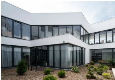
Maison des services publics – Un patio creusé au cœur de la MSP diffuse une abondante lumière dans toutes les salles, à l'étage il est bordé par une déambulation fluide.

De son côté, la Maison des services publics se veut plus musicale avec ses façades faites de fins modules de béton rythmés verticalement. Cette nouvelle structure ayant pour objectif de faciliter les démarches des habitants regroupe pas moins de cinq services en une seule enveloppe. La nature des activités, portées vers l'assistance et l'accueil, dont un certain nombre d'enfants, nécessitait donc de protéger l'intimité des lieux. Le filtre de façade remplit cette fonction. Il protège également du rayonnement solaire sans nuire à la diffusion de la lumière. Celle-ci est d'autant plus abondante que les plateaux sont percés d'un patio central et que les parois nord-ouest sont entièrement vitrées vers de larges terrasses en R+1 et R+2 ainsi que sur un jardin en rez-de-chaussée dont bénéficient les enfants de la crèche. Le gabarit de la MSP s'intègre ainsi parfaitement avec les immeubles d'habitation voisins étagés en escalier. Toute hauteur sur une partie de la rue, le voile de façade se soulève avec douceur pour emmener les usagers jusqu'à l'entrée dans la maison protégée par un porte-à-faux qui entretient une continuité visuelle avec celui du gymnase. Cet écran protecteur qui singularise l'équipement est réalisé à partir d'éléments en béton préfabriqués dont le profil irrégulier présente cinq à six faces et décline cinq modèles. Ils sont fixés en deux points à une solide structure, également de béton, qui en reprend les charges.