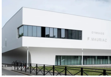
Gymnase François-Mauriac - Le gymnase semble découpé dans son épaisseur pour générer des auvents protecteurs et apporter de la lumière naturelle dans chacune des salles.

Le gymnase et la Maison des services publics, édifiés sur une parcelle commune, symbolisent avec brio le renouveau d'un quartier en pleine mutation urbaine.